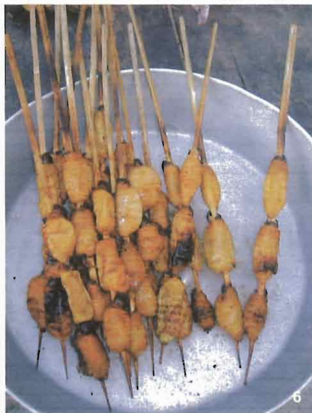
Fig. 3. Estípide de Mauritia flexuosa tumbado en la región de Jenaro Herrera (Loreto, Perú). Fig. 4. Estípide de Mauritia flexuosa abierto para recoger las larvas de suri en la región de Jenaro Herrera (Loreto, Perú). Fig. 5. Larvas de suri cocinadas en anticuchos en el mercado Bellavista-Nanay, Iquitos. Fig. 6. Vendedora de suri cocinados en anticuchos en el mercado de Bellavista-Nanay, Iquitos.