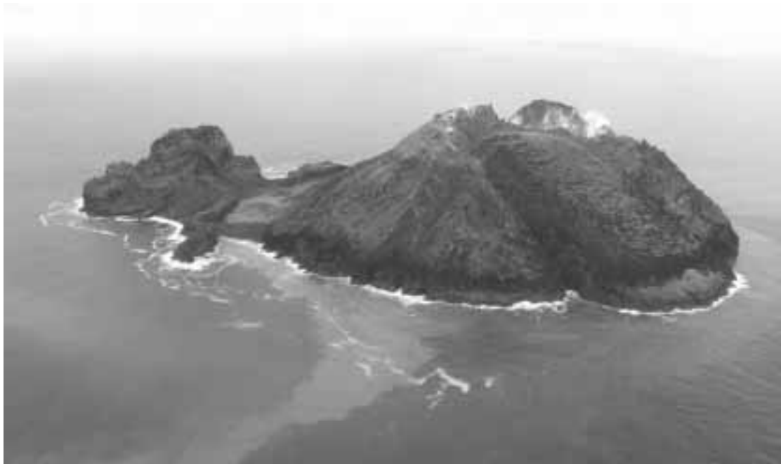
FIG. 1. - Approche de l'île Matthew par le nord, 17 avril 2008