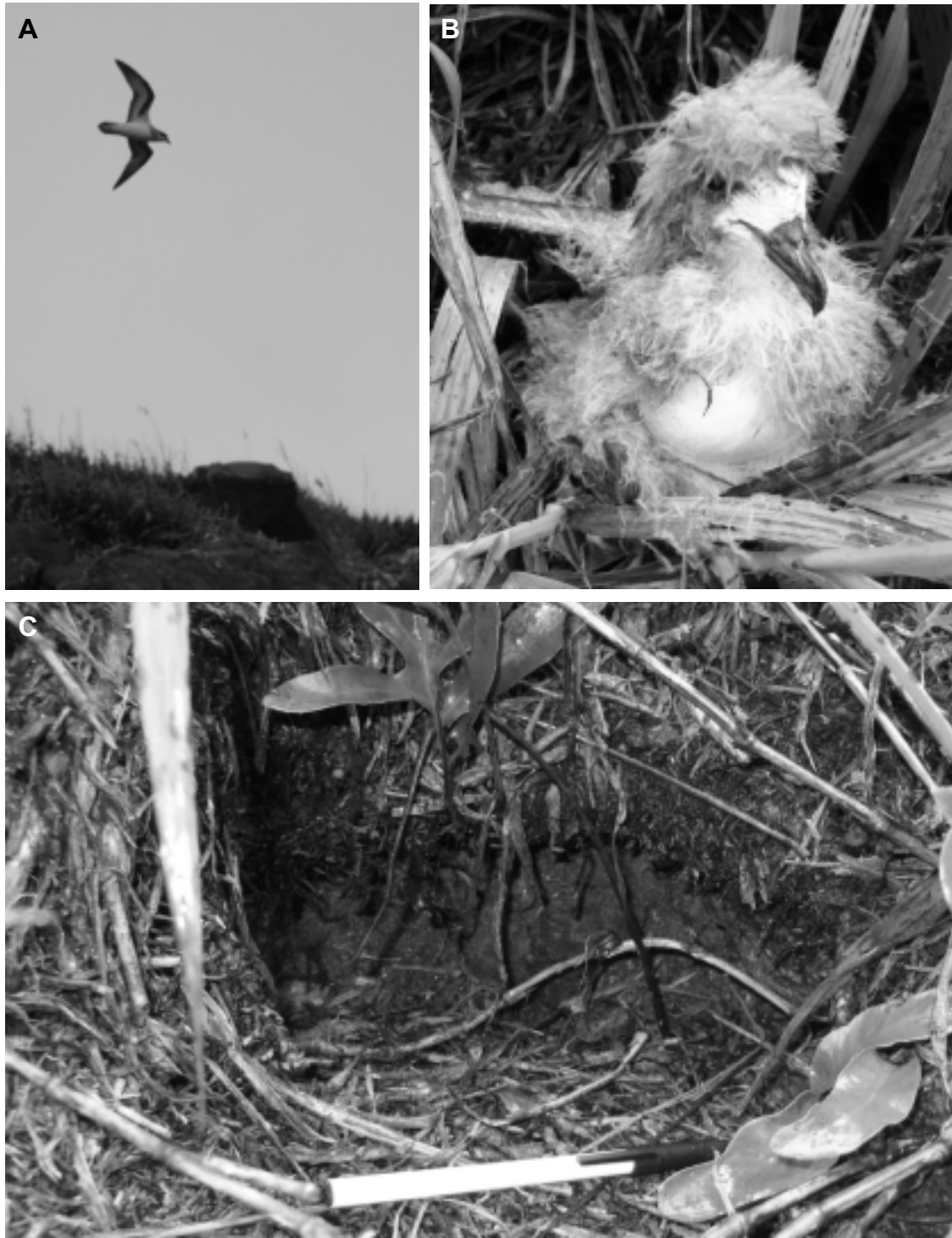
FIG. 3. - Pétrel à ailes noires ( Pterodroma nigripennis ) sur l'île Matthew (17 avril 2008). A. Individu adulte survolant sa colonie à mi-hauteur sur le flanc est du volcan principal. B. Poussin proche de l'envol, capturé au fond de son terrier dans la colonie située dans la faille du Puits, flanc est du volcan principal. C. Entrée de terrier, creusé dans la tourbe sous un tapis de fougères, flanc est ; échelle : 15 cm