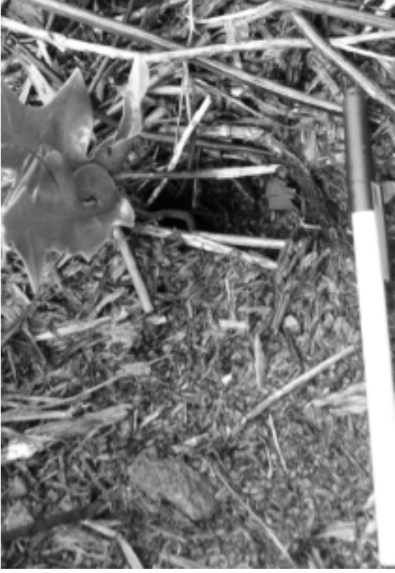
FIG. 6. - Entrée d'un terrier de petit pétrel (?), creusé dans la tourbe sous les fougères. Pentes du Puits, flanc est du volcan principal, île Matthew (17 avril 2008). Echelle : 15 cm