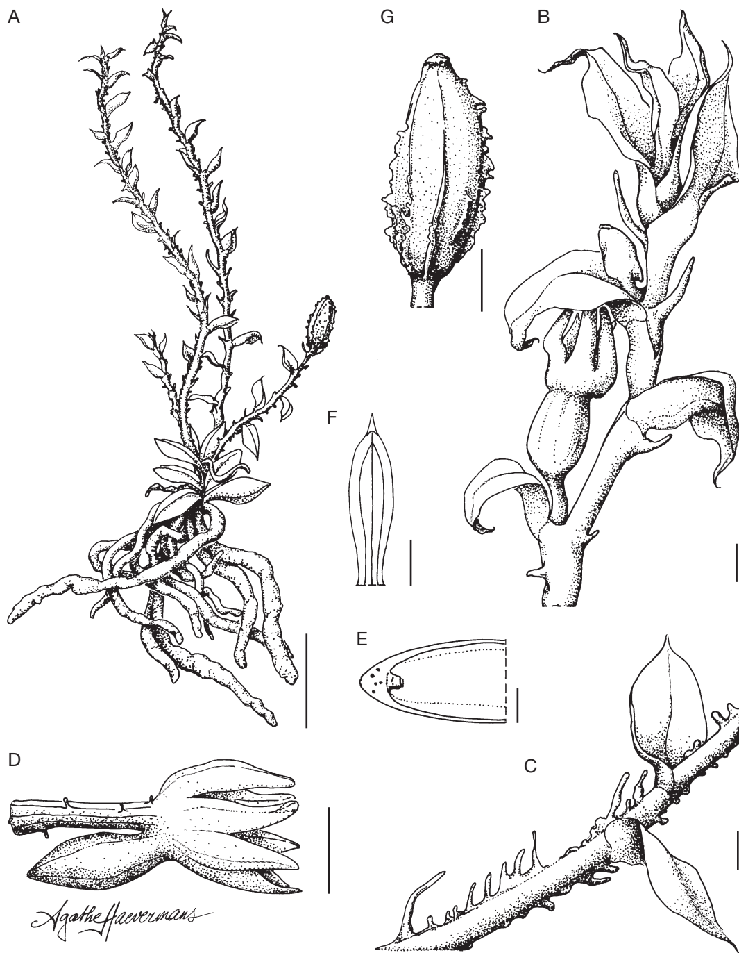
FIG. 1. — Microtatorchis labatii M.Pignal & Munzinger, sp. nov.: A , aspect général; B , inflorescence; C , détail de l'inflorescence et des bractées; D , fleur; E , coupe de l'éperon; F , labelle; G , fruit. B. Suprin s.n. (NOU). Échelles: A, 1 cm; B, C, G, 1 mm; D, 0,5 mm; E, F, 0,2 mm. Dessin Agathe Haevermans.