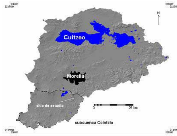
Figura 1. Ubicación del área experimental de estudio.