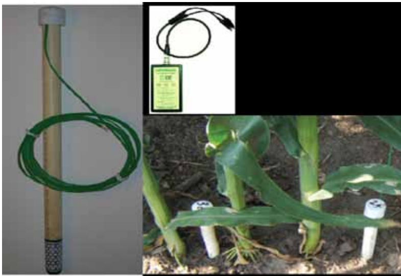
Figura 2. Sensor de humedad, lector e instalación en campo