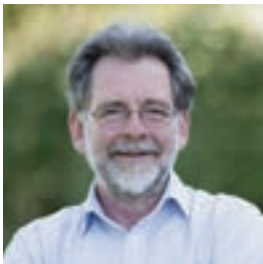
Course Convenor: Professor Hugh White

Asia is in the throes of a major power-political revolution, as a radical change in the distribution of wealth and power overtakes the old order and forces the creation of a new one. Explore three areas of the new power politics of Asia: the nature of power politics as a mode of international relations; the power politics of Asia today, what is happening and where it is going; and concepts that can help us better understand power politics.