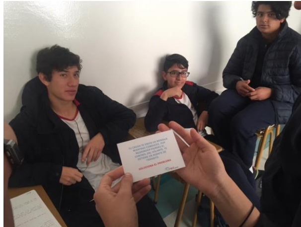
Fotografía 1: Grupo Focal y Juego de Roles

Al terminar con el juego de roles se realizaron preguntas sobre el soborno a agentes de tránsito en donde se dio tiempo para que los alumnos compartan sus ideas sobre la naturalización de la corrupción.