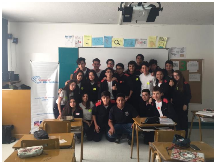
Fotografía 5: Capacitación 4

conversatorio en base a la pregunta ¿Cómo mantener mis convicciones en el futuro, si es que me veo en una situación de corrupción? Esta capacitación fue el 29 de abril del 2019 y tuvo una duración de 40 minutos.