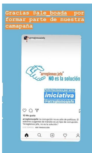
Figura 8: Influencer 2 Ale Boada