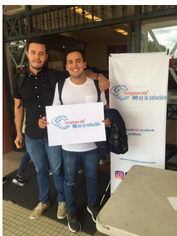
Fotografía 7: BTL USFQ