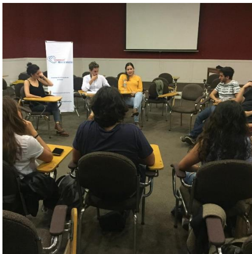
Fotografía 6: Capacitación USFQ

para dar charlas en otros eventos efectuados por la misma. Esta charla contó con 25 participantes de distintas carreras y edades. La temática de esta capacitación fue “Cómo afecta la Corrupción en la vida cotidiana”. Se analizaron conceptos de corrupción, leyes y consecuencias económicas y sociales de la micro corrupción.