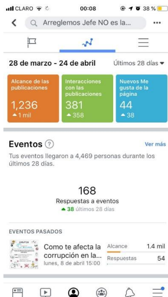
Figura 10: Alcance Facebook