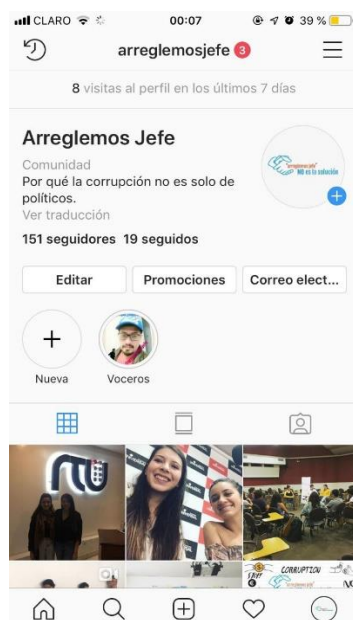
Figura 11: Seguidores en Instagram