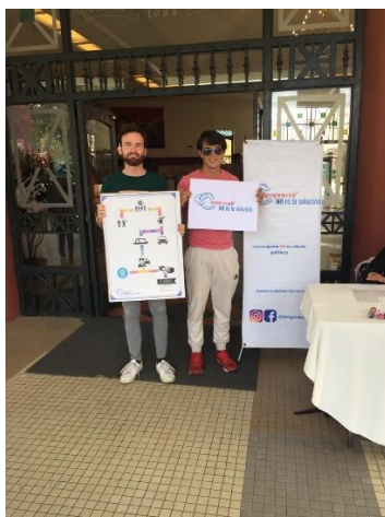
Fotografía 8: BTL USFQ