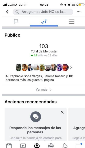
Figura 9: Likes en Facebook

La página de Facebook de la campaña puede ser encontrada como @arreglemosjefe y obtuvo 103 seguidores durante los meses de publicación e interacción.