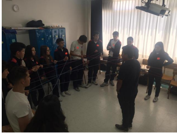
Fotografía 3: Capacitación 2

Por otro lado, la tercera sesión fue el 22 de abril del 2019 con una duración de 40 minutos y trató temas de comportamiento social entre el agente de tránsito y el conductor. Aquí se realizó una evaluación sobre las opciones de comportamiento: honestidad vs corrupción. Después se analizaron las implicaciones de la corrupción y cómo influye en la vida diaria. Finalmente, se describió los deberes y derechos que los ciudadanos tienen al momento de realizar una infracción de tránsito.