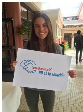
Fotografía 9: BTL USFQ