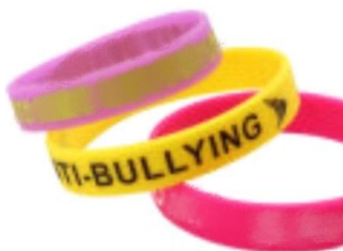
Figura 5. Pulsera de silicón

Se elaborará una pulsera de silicón brandeada con el logo de la campaña Break the bullying, esta será promocionada en los CAVS e islas de Netlife de atención al cliente a nivel nacional, un total de 29 puntos y tendrá el valor de $1.