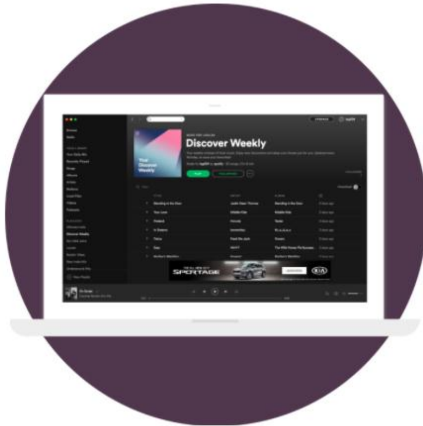
Figura 1. Ejemplo de Mega Banner en Spotify