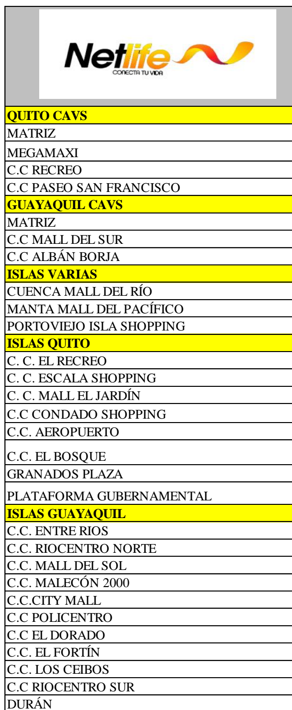
Tabla 5. CAVS e Islas de Netlife a nivel nacional