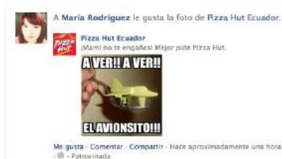
Figura 3. Ejemplo de Page Post Ad

Con el propósito de viralizar de manera eficiente los contenidos relevantes de la página y aumentar la interacción, se empleará el formato Page Post Ad, tanto para fans como para no fans de la página. Alcanza altas cuotas de likes, comments y shares. En el page post ad de video, tenemos la posibilidad de linkear un video desde YouTube o subirlo directamente a Facebook.