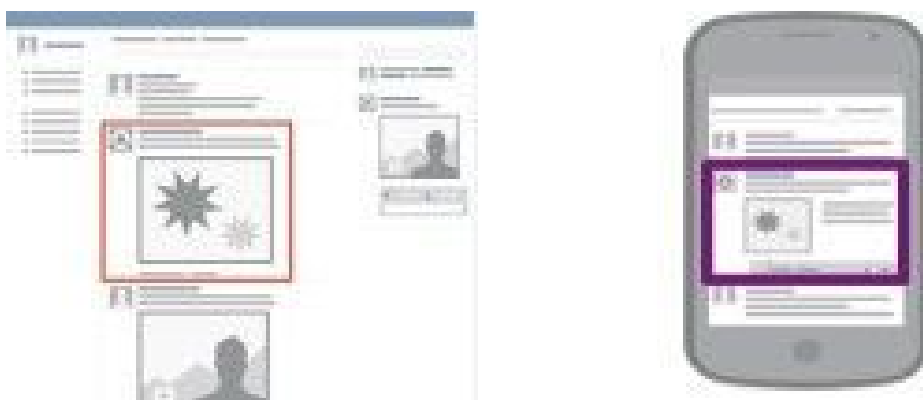
Figura 4. News Feed en computadoras y teléfonos móviles.

Los posts del Page Post Ad aparecerán en el News Feed (es lo primero que aparece cada vez que nos logueamos en la red social. Se visualiza un sinfín de noticias, fotos, videos y estados). Estos posts están disponibles en computadoras y teléfonos móviles.