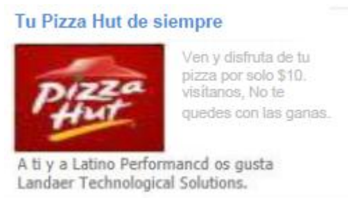
Figura 2. Ejemplo de Social Ad