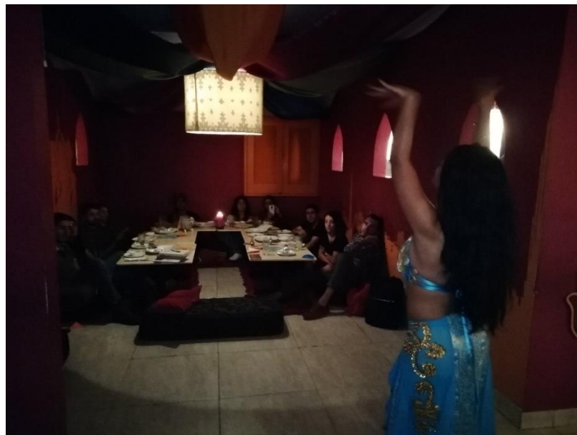
Festín de LEO: Sabores árabes.

En Las mil noches y una noche , Alí Babá dice las palabras mágicas “ Ábrete Sésamo ” para entrar en la cueva que contiene los tesoros jamás soñados. No es de extrañar que sean unas semillas de ajonjolí, que son un alimento para el cuerpo, las responsables de abrir las puertas del lugar de las piedras preciosas y monedas de oro. A mí me basta decir: ¡Festín de LEO! para que aparezcan amigos dispuestos a entrar a ese territorio de la imaginación, por medio de las palabras y la alimentación.