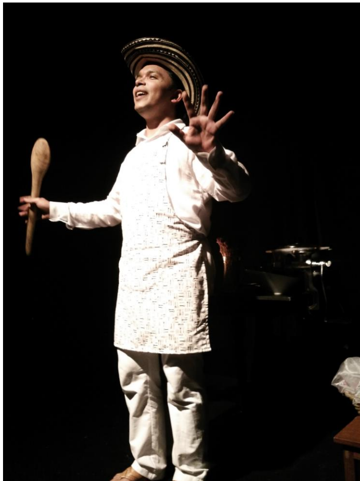
Fotografía de Julián Florez para el espectáculo de narración oral Dulce de plátano maduro .

La narración oral llegó a mi vida como suelen llegar las cosas mágicas, sin esperarlas. Lo mismo, pienso, le sucedió a Ali Babá cuando descubrió sin habérselo propuesto las palabras mágicas para abrir la cueva de los tesoros. El acto de narrar en voz alta me hace pensar en Sherezada, narradora de Las mil noches y una noche quien, para salvar su vida, le cuenta una historia al rey Shariar, un déspota que piensa que no hay corazón más pérfido que el de la mujer, por eso ha decidido desposar una virgen cada noche para darle muerte en manos de su verdugo justo antes del amanecer. Sherezada entonces hace uso de las historias para dilatar el momento de su ejecución y hábilmente le