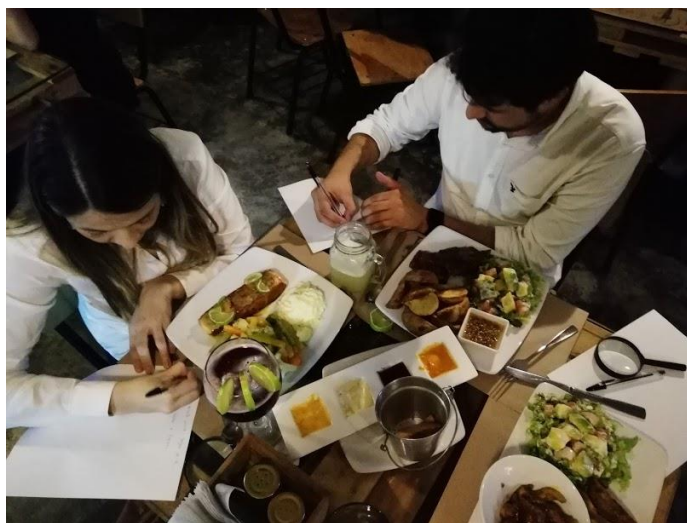
El Festín de LEO: Descifrando una comida

los encuentros en los restaurantes Brasilia, Tabun, Botaniko y Aula. Ante mis sentidos sale a flote la certeza de que en esa experiencia se desnaturalizó el acto de comer, como si se acercara al alimento con otro cuerpo, con un nuevo olfato y gusto para disfrutar los sabores. Siempre he creído que uno no vuelve a acercarse igual a una comida, después de haber conocido algo de su historia. En cada encuentro hubo una evocación histórica de cómo surgieron los alimentos.