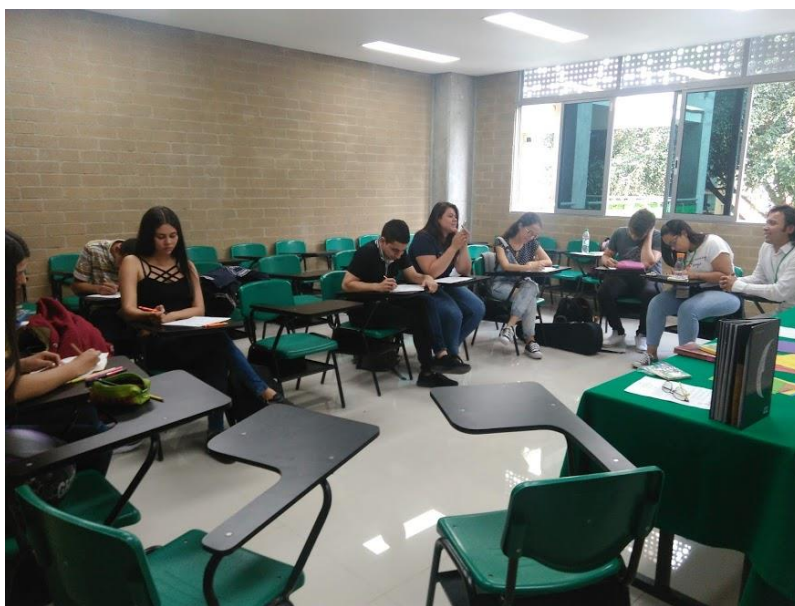
Taller Sabores y conversas: El sabor de los recuerdos

Estos sabores se extendieron también a otros espacios como eventos académicos donde tuve la oportunidad de participar como tallerista. Es el caso del I Encuentro de Prácticas pedagógicas en torno al lenguaje: narrativas, experiencias y creación artística , realizado en octubre de 2018 en el Tecnológico de Antioquia. Allí se vincularon otros comensales con sus trayectorias lectoras y alimentarias en un banquete que dejó sazones en el corazón y en la palabra.