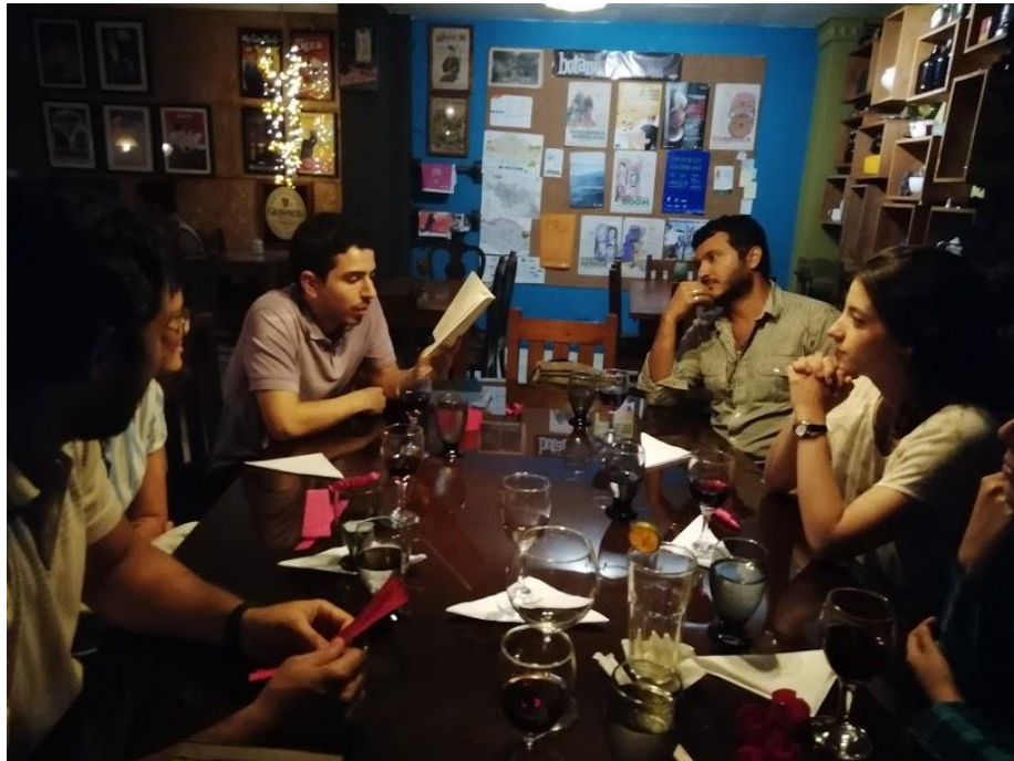
El Festín de LEO: Sabor a ciegas

Ingredientes: Amigos en el Restaurante Botaniko, lectura de las propias historias sobre alimentos y vida.