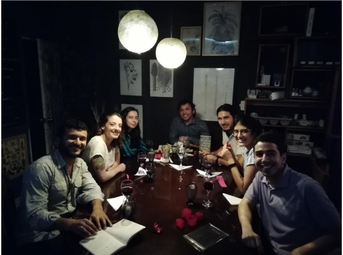
El Festín de LEO: Sabor a ciegas

Ingredientes: Amigos en el Restaurante Botaniko, sabores a ciegas a la luz de los poemas Animal de oscuros apetitos de Nelson Romero.