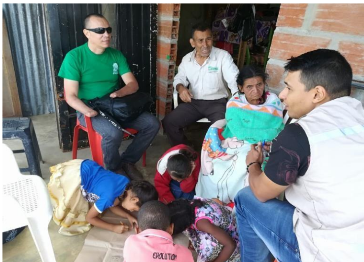
Ilustración 5, Barrio La Avanzada, comuna 1, familia 4. Registro fotográfico propio.