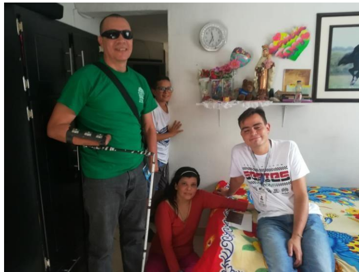
Ilustración 3, Barrio Popular, comuna 1, familia 2. Registro fotográfico propio.

para una persona con movilidad reducida en el momento de salir de la casa. La persona con discapacidad se nota animada, motivada y es bastante participativa en la actividad; manifestó que se identificaba mucho con la lectura que estaba haciendo porque en días pasados había vivido en una amargura porque no le gustaba expresar sus emociones y sentimientos y que se vestía siempre de negro, cosa que en la actualidad es diferente, porque, ya expresa todo lo que siente y lo que piensa. De esta manera se hace posible notar como el acompañamiento de Biblioteca en Casa por medio de este proyecto va generando cambios en las personas con discapacidad, las cuales manifiestan la gratitud que tienen con el proyecto.