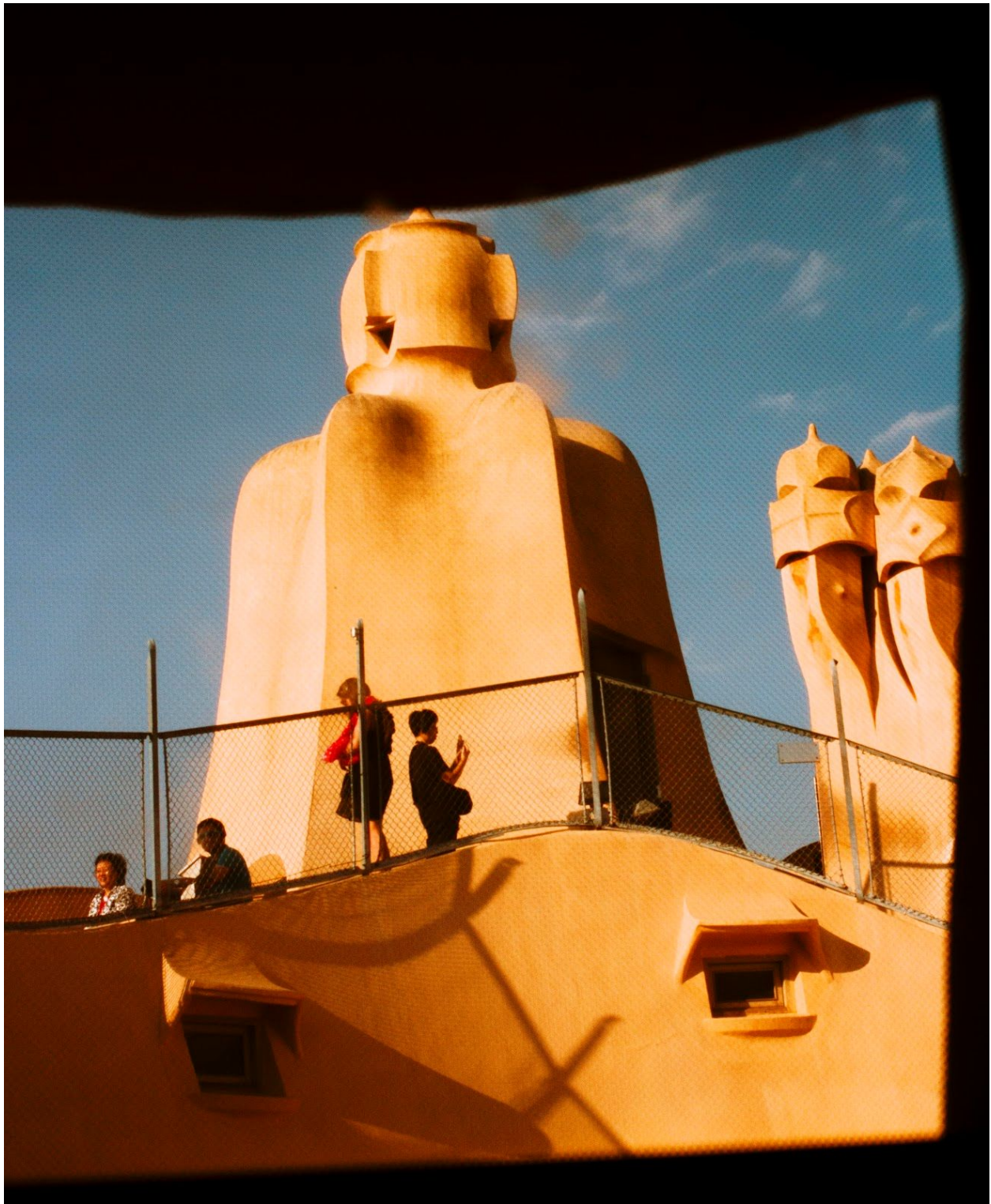
“La Pedrera”, del otoño en España