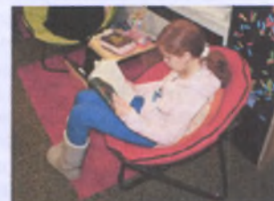
г – индивидуальная форма.