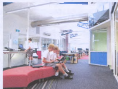
в – игровая форма;