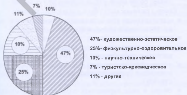
Рис. 3. Основные направления работы учреждений дополнительного образования