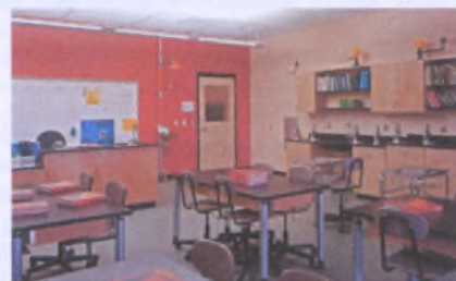
б – активная форма;