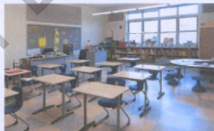
а – организационная форма;