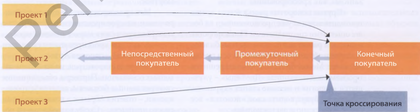
Рисунок 2 Схема кросс-пул-промоции (кроссированного притягивающего воздействия)