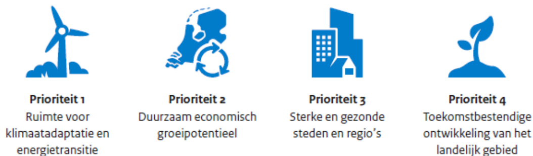
Figuur 1: Vier Prioriteiten beschreven in de NOVI versie van September 2020

Naar verwachting zal in januari 2022 de nieuwe Omgevingswet in werking treden. Het Rijk 5 wil met de nieuwe wet de regelgeving voor ruimtelijke projecten bundelen en vereenvoudigen. De Nationale Omgevingsvisie zal de ruimtelijke beleidsnota's, zoals we die tot nu toe kenden in het kader van de Wet op de Ruimtelijke Ordening, vervangen. De NOVI bevat een integrale visie op de lange termijn ontwikkeling van de fysieke leefomgeving en heeft daarmee een bredere en meer integrale reikwijdte dan de huidige ruimtelijke beleidsnota's. De bron voor de inschatting van effecten was de Ontwerp NOVI van Juni 2019. 6 De wijzingen in de versie van NOVI van September 2020 konden niet meer gedetailleerd worden geëvalueerd. Een korte screening liet zien dat de prioriteiten en beleidskeuzes in hoofdlijnen niet veranderd zijn.