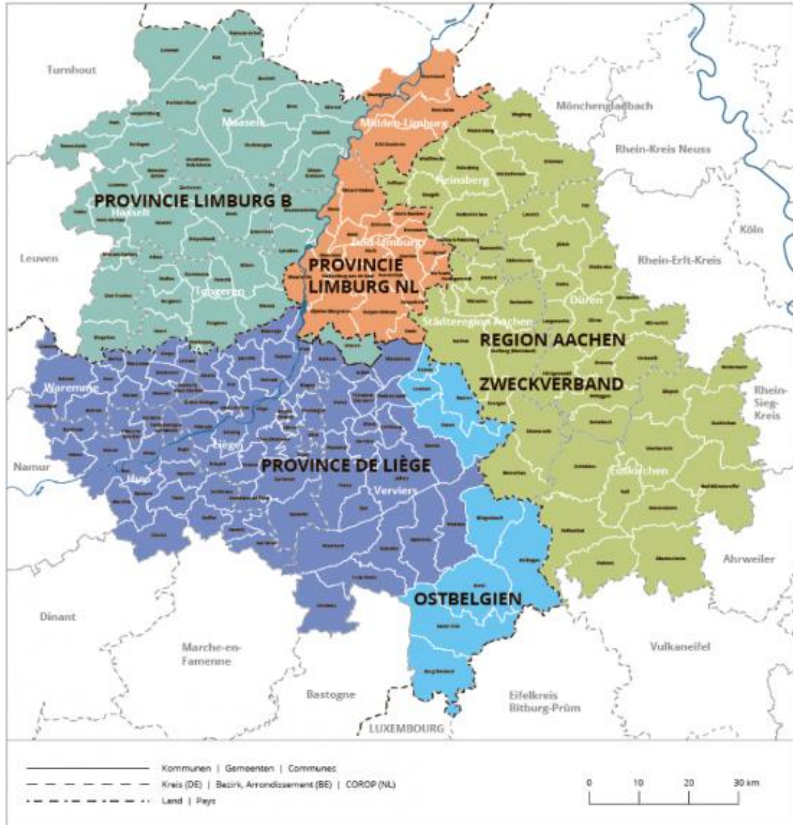
Figuur 3: Het gebied van de Euregio Maas-Rijn (EMR)