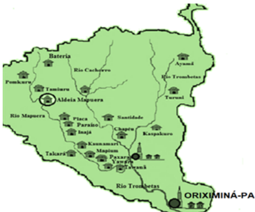
Figura 2 - Localização da Aldeia Mapuera no município de Oriximiná-PA

mostra a localização das aldeias indígenas no rio Mapuera e Cachorro, com destaque para a Aldeia Mapuera, dando ideia do percurso percorrido para se chegar até a aldeia central: