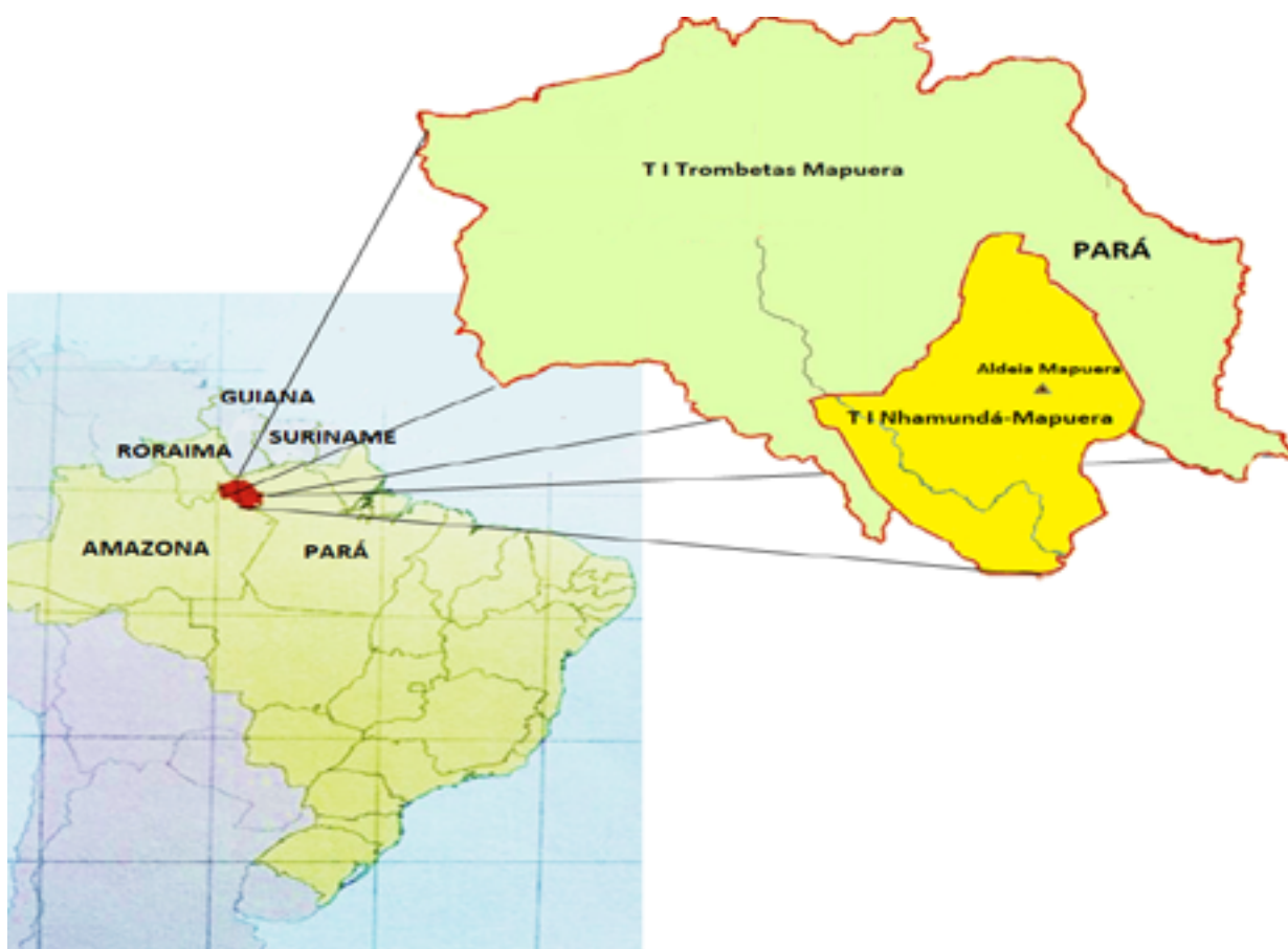
Figura 1 - Localização das Terras Indígenas Trombetas-Mapuera e Nhamundá-Mapuera.

Fonte: Elaborado pelo autor. Câncio (2020).