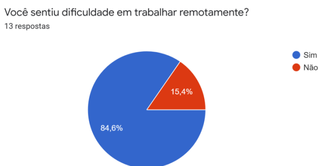
Gráfico 1: Você sentiu dificuldade em trabalhar remotamente?

Quanto ao uso das tecnologias, 84,6% dos professores (as) responderam que tiveram dificuldades com o trabalho remoto e 15,4% responderam que não sentiram dificuldades em trabalhar remotamente. 61,5% disseram que receberam algum tipo de apoio para trabalhar remotamente e 38,5% disseram não ter recebido.