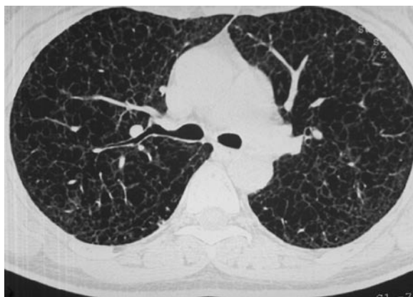
Figure 1. HRCT – multiple, thin-walled cystic airspaces, usually round in shape. The cysts are distributed diffusely throughout both lungs.

Celem pracy jest przedstawienie przypadku limfangioleiomatozy, który przez lata stanowił olbrzymi problem dla lekarzy wielu specjalności, ze ślepyimi zaułkami diagnostyki i terapii zanim udało się ustalić właściwe rozpoznanie.