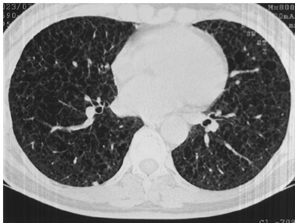
Figure 4. HRCT – small nodules in the peripheral lung zone.

Rycina 2. HRCT – górne płaty zajęte są w podobnym stopniu jak na ryc 1.