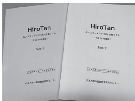
図2 冊子体の単語集