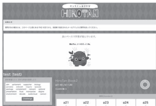
図1 オンライン単語学習 HiroTan (WBT 教材)

本リストの開発は2009年度に着手され、2011年度に正式運用が開始された。リストの概要や開発の経緯、そして本学におけるこれまでの具体的な活用方法については、榎田他（2018）で説明したとおりである。「コミュニケーション基礎Ⅰ・Ⅱ」の受講者には、語彙・文法の知識養成を目的としたWBT（Web-Based Training）教材とともに、冊子体の単語集が提供されている（図1、図2）。榎田他（2018）をもとにまとめた同リストの概要を表1、表2に示す。