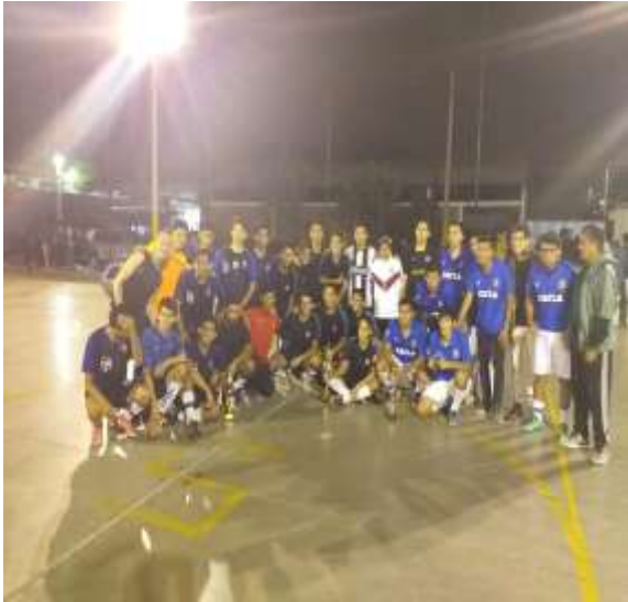
Fuente: Unidad de Bienestar, 2019 – Foto capturada en el Interfacultades de Fútbol Masculino.