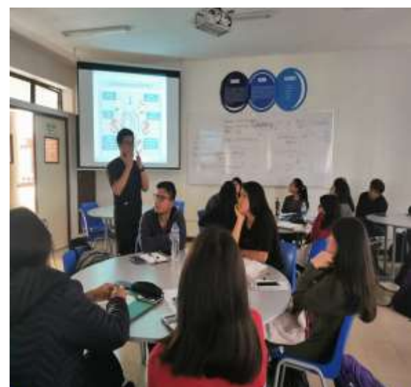
Fuente: Unidad de Bienestar, 2019 – Foto capturada en la Campaña de Salud (Charla informativas en las aulas sobre salud bucal).