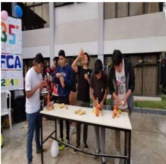
Foto capturada en el desarrollo de la Gymkana con la participación de los estudiantes de pregrado de la FCA en el marco del 35° aniversario de la Facultad.