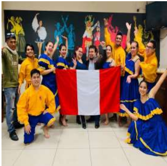
Foto capturada en la presentación artística de los estudiantes miembros del Taller de Danza en la Asociación Cultural Brisas del Titicaca - Lima.