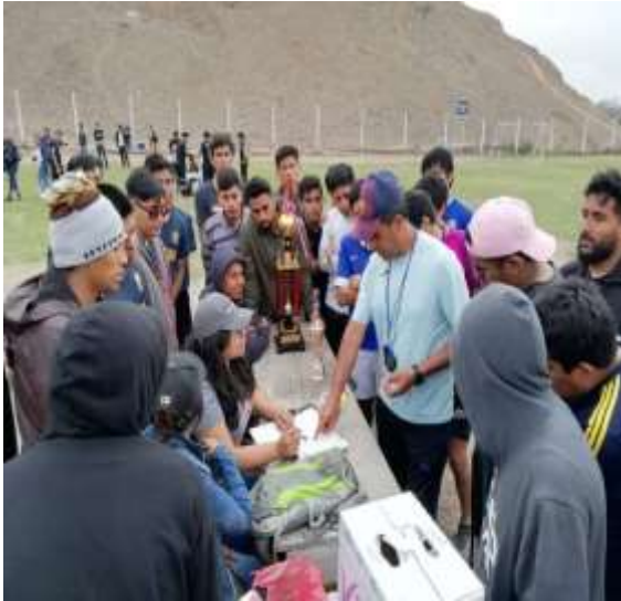
Foto capturada en el desarrollo del Campeonato Deportivo con la participación de los estudiantes de pregrado de la FCA en el marco del 35° aniversario de la Facultad.