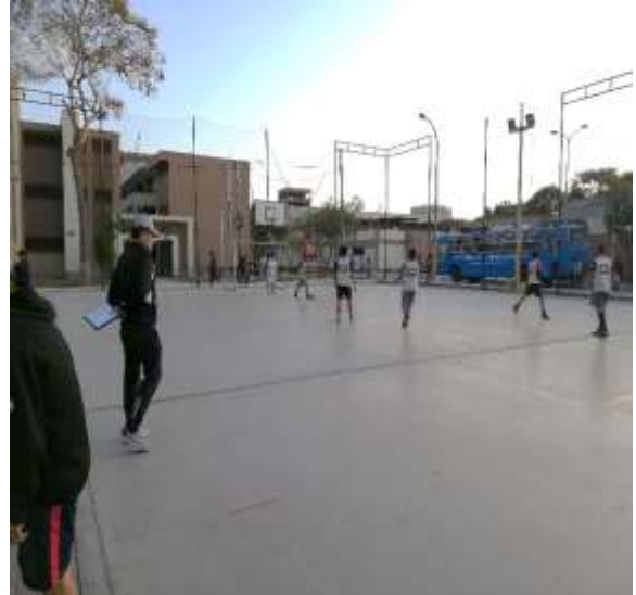
Fuente: Unidad de Bienestar, 2019 – Foto capturada en el desarrollo del Taller de Fútbol Masculino.