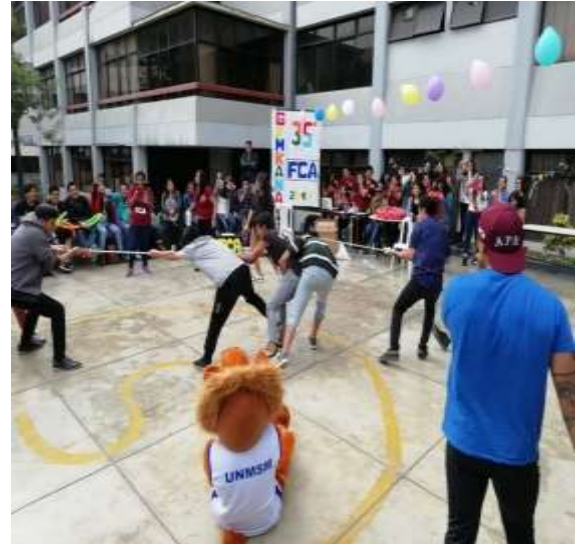
Foto capturada en el desarrollo de la Gymkana con la participación de los estudiantes de pregrado de la FCA en el marco del 35° aniversario de la Facultad.