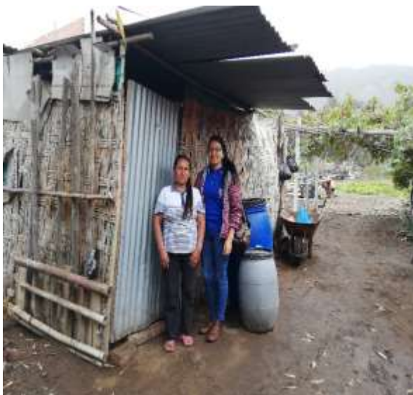
Foto capturada en la visita domiciliaria al uno de los estudiantes de la FCA postulante a Beca Residencia Universitaria (Santa Cruz de Flores, Cañete).