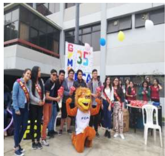
Fuente: Unidad de Bienestar, 2019 – Foto capturada en el desarrollo de la Gymkana con la participación de los estudiantes de pregrado de la FCA en el marco del 35° aniversario de la Facultad.