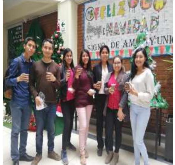
Foto capturada en el desarrollo del Chocolatada con la participación de los estudiantes de pregrado de la FCA.