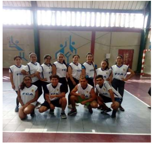
Foto capturada en el interfacultades de Aerotón.