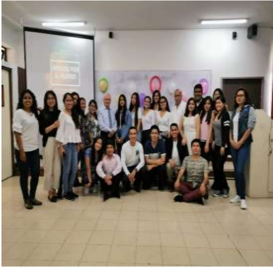
Foto capturada en la Actividad de despedida de los estudiantes de intercambio estudiantil 2019-2 organizado por los estudiantes del Programa de Voluntariado Amigos por el Mundo en coordinación con la Unidad de Bienestar.