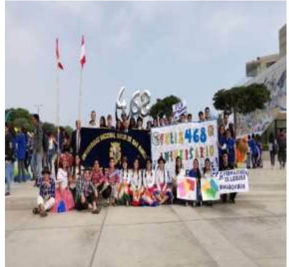
Foto capturada de la participación de estudiantes, docentes y personal administrativo de la FCA en el Concurso de Pasacalle en el marco del 468° aniversario de la UNMSM.