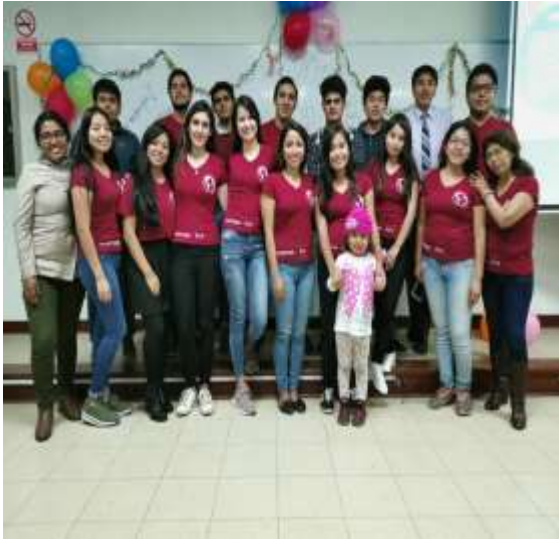
Fuente: Unidad de Bienestar, 2019 – Foto capturada en la Actividad de despedida de los estudiantes de intercambio estudiantil 2019-1 organizado por los estudiantes del Programa de Voluntariado Amigos por el Mundo en coordinación con la Unidad de Bienestar.