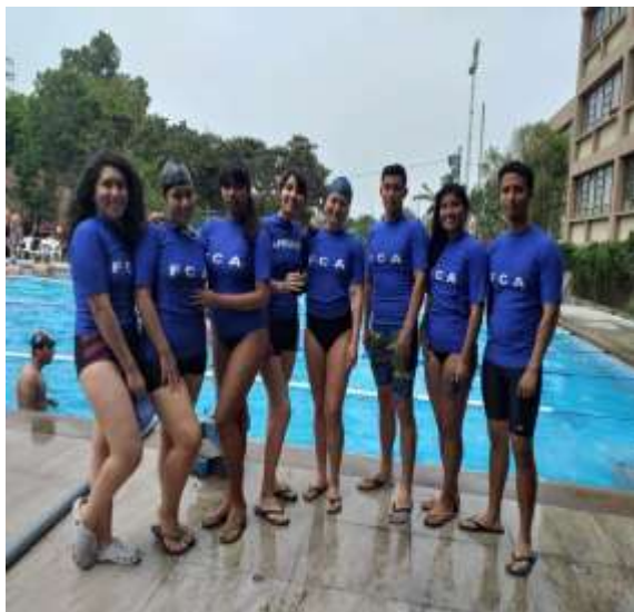
Fuente: Unidad de Bienestar, 2019 – Foto capturada en el Interfacultades de Natación.