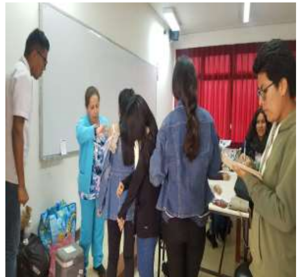
Foto capturada en la Campaña de Salud (Servicio de Vacunación en las aulas).