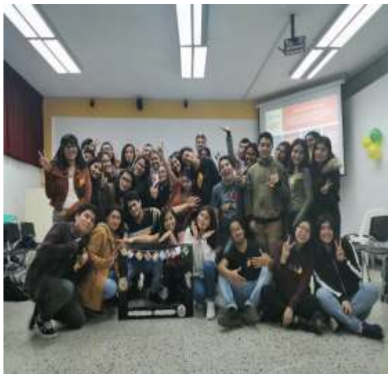
Foto capturada en la Bienvenida de los estudiantes de intercambio estudiantil 2019-2 organizado por los estudiantes del Programa de Voluntariado Amigos por el Mundo en coordinación con la Unidad de Bienestar.