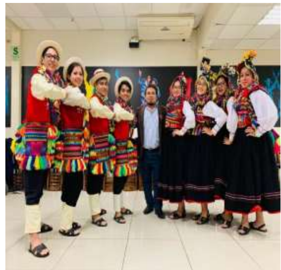
Foto capturada en la presentación artística de los estudiantes miembros del Taller de Danza en la Asociación Cultural Brisas del Titicaca - Lima.