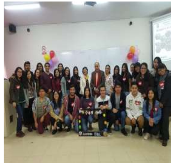
Foto capturada en la Actividad “Asignación de un patrner a cada estudiante de intercambio de la FCA 2019-2” organizado por los estudiantes del Programa de Voluntariado Amigos por el Mundo en coordinación con la Unidad de Bienestar.