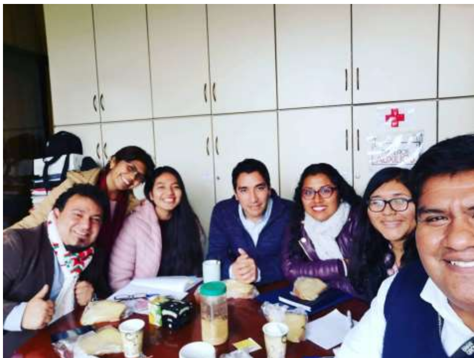
Fuente: Unidad de Bienestar, 2019 – Foto capturada en la Reunión de Planificación de Actividades del equipo de la Unidad de Bienestar.