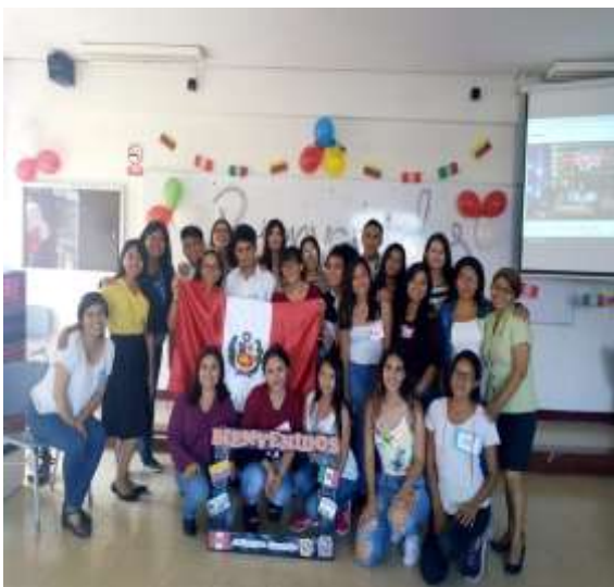
Foto capturada en la Bienvenida de los estudiantes de intercambio estudiantil 2019-1 organizado por los estudiantes del Programa de Voluntariado Amigos por el Mundo en coordinación con la Unidad de Bienestar.