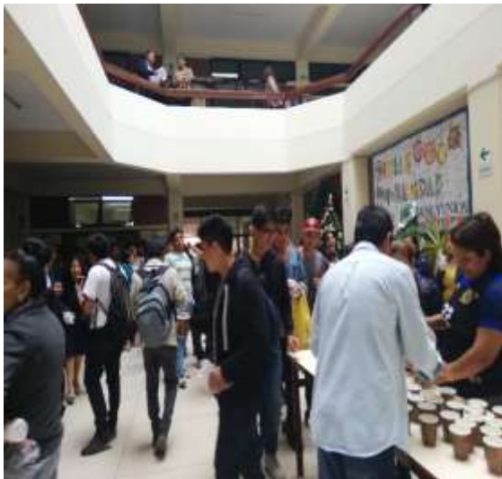
Foto capturada en el desarrollo del Campeonato Deportivo con la participación de los estudiantes de pregrado de la FCA en el marco del 35° aniversario de la Facultad.