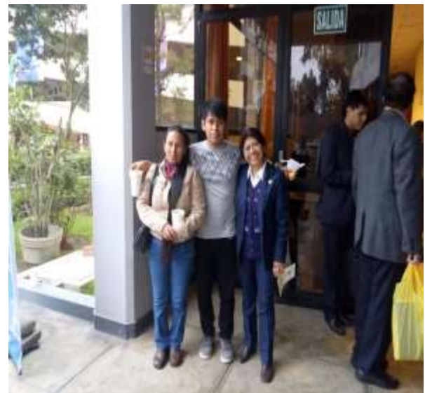
Foto capturada en la Ceremonia de Becados Residencia Universitaria 2019 (El estudiante que se le realizó la visita domiciliaria en Santa Cruz de Flores accedió a la Beca de Residencia).