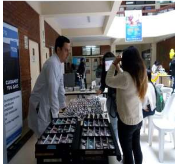
Fuente: Unidad de Bienestar, 2019 – Foto capturada en la Campaña de Salud (Servicio de Oftalmología).