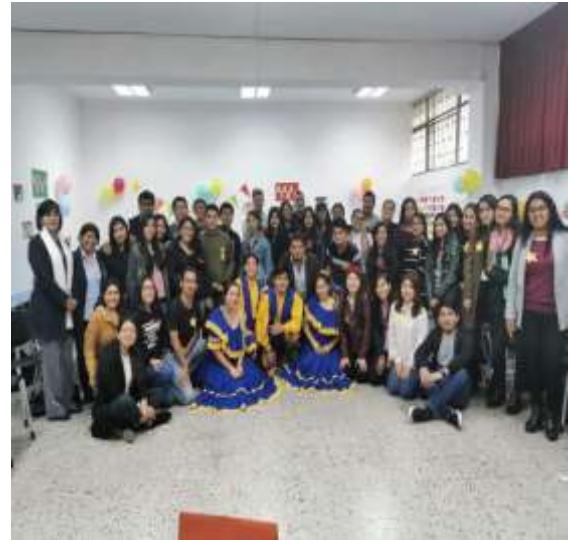
Foto capturada en la Bienvenida de los estudiantes de intercambio estudiantil 2019-2 organizado por los estudiantes del Programa de Voluntariado Amigos por el Mundo en coordinación con la Unidad de Bienestar.