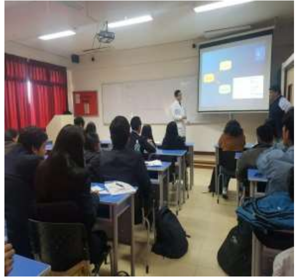
Fuente: Unidad de Bienestar, 2019 – Foto capturada en la Campaña de Salud (Charla informativas en las aulas sobre prevención de la Tuberculosis).