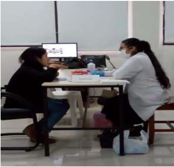
Foto capturada en la Campaña de Salud (Servicio de Medicina General).