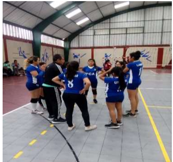
Fuente: Unidad de Bienestar, 2019 – Foto capturada en el Interfacultades de Vóley Femenino.