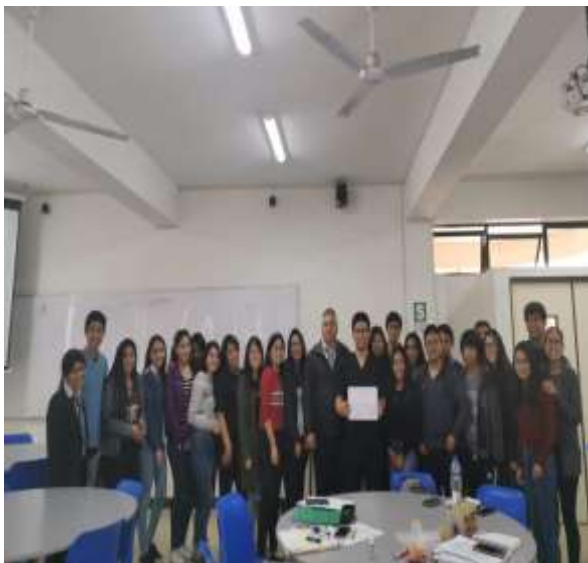
Fuente: Unidad de Bienestar, 2019 – Foto capturada en la Campaña de Salud (Charla informativas en las aulas sobre salud bucal).