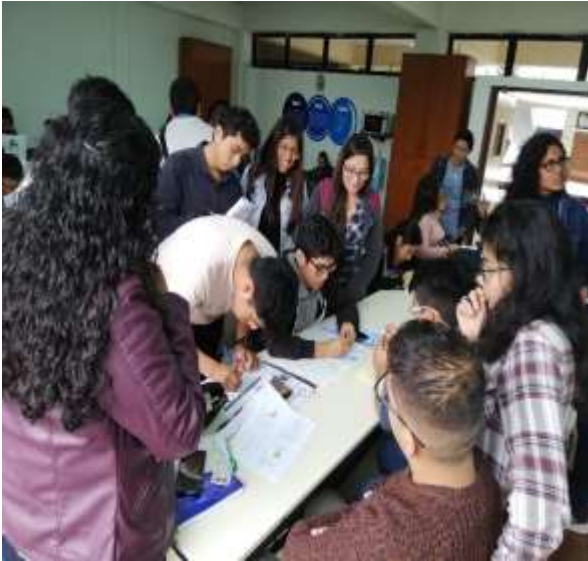
Fuente: Unidad de Bienestar, 2019 – Foto capturada en la Campaña Informativa sobre la Convocatoria de Beca Permanencia Académica PRONABEC en las aulas.