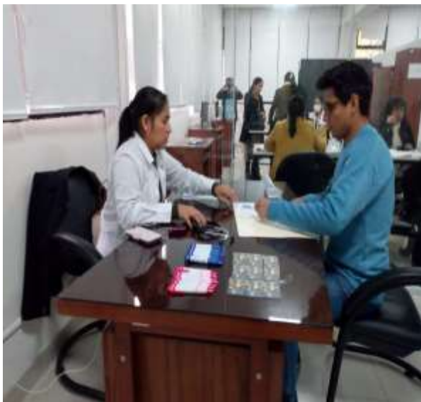
Fuente: Unidad de Bienestar, 2019 – Foto capturada en la Campaña de Salud (Servicio de Psicología).