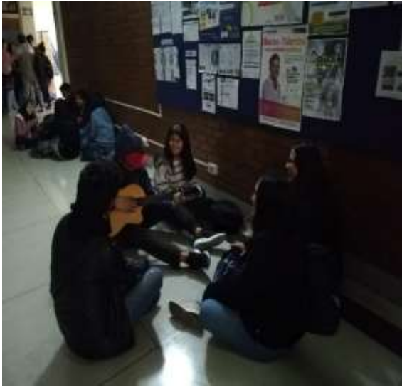
Foto capturada del uso de los instrumentos musicales de la Unidad de Bienestar por los estudiantes en sus horas libres.