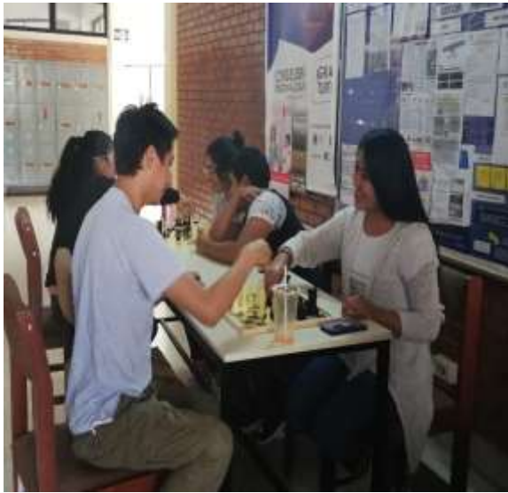
Fuente: Unidad de Bienestar, 2019 – Foto capturada en el desarrollo del Taller de ajedrez.