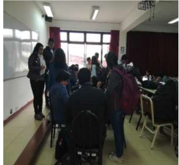
Fuente: Unidad de Bienestar, 2019 – Foto capturada en la Campaña Informativa sobre la Convocatoria de Beca Permanencia Académica PRONABEC en las aulas.