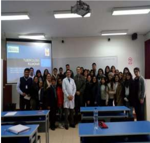
Foto capturada en la Campaña de Salud (Charla informativas en las aulas sobre prevención de la Tuberculosis).