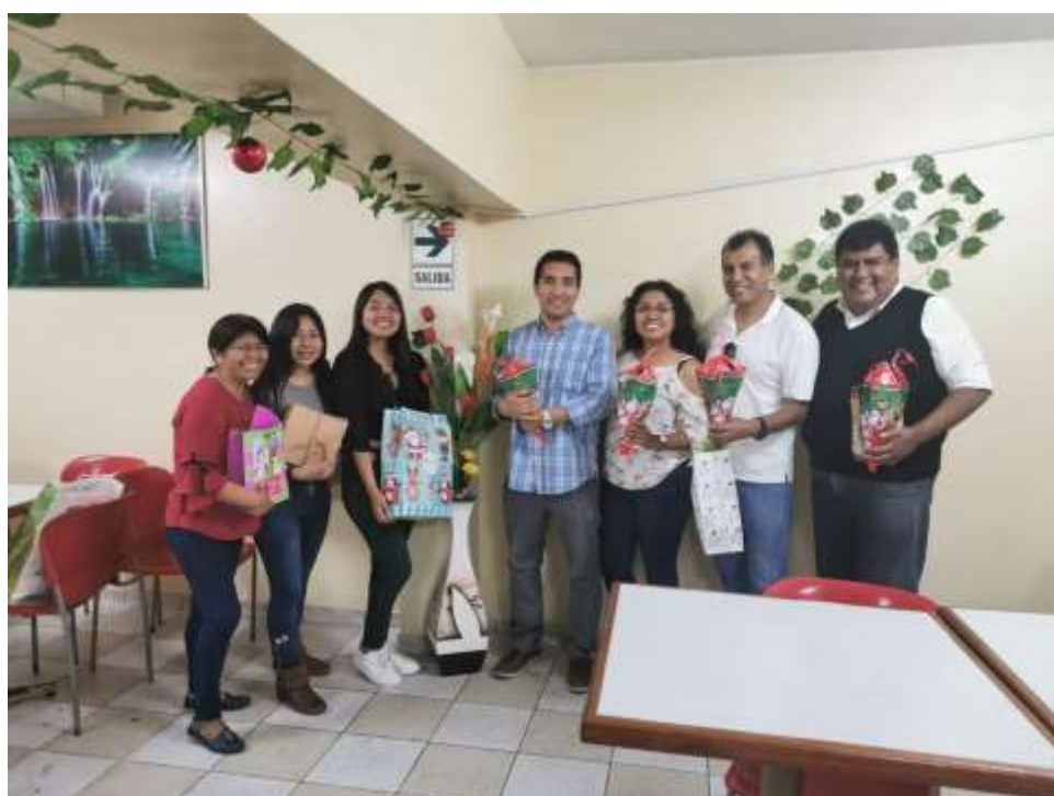
Foto capturada en la Actividad de integración por el término del año de trabajo 2019 del equipo de la Unidad de Bienestar.