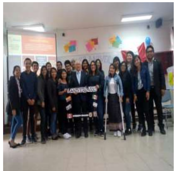
Foto capturada en la Actividad “Asignación de un patrner a cada estudiante de intercambio de la FCA 2019-1” organizado por los estudiantes del Programa de Voluntariado Amigos por el Mundo en coordinación con la Unidad de Bienestar.