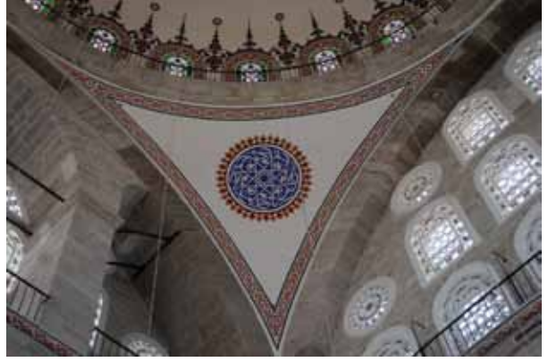
Fotoğraf 8. Ana kubbe pandantiflerinde uygulanan kalemîşi tezîyat.