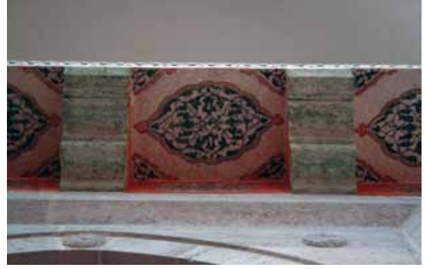
Fotoğraf 12. Cümle kapısı üzeri konsolları arasında ortaya çıkarılan kalemiş tezyinat.

Osmanlı klasik mimarisinin bir örneği olan Mihri-mah Sultan Camii'nin özgün bezemeleri ne yazık ki günümüze kadar ulaşmamıştır. Restorasyon uygulamaları esnasında yaptığımız raspalarda, yukarıda da yansıttığımız üzere çok az ilk dönem kalemiş kalıntlarına ula-