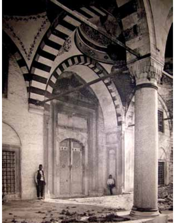
Fotoğraf 1 ve 2. Cornelius Gurlitt, İstanbul'un Mimari Sanatı kitabında yer alan fotoğraflar.