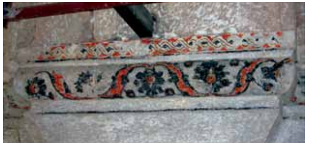
Fotoğraf 11. 1. kat silmesi üzerinde ortaya çıkarılan kalemîşi bordür.