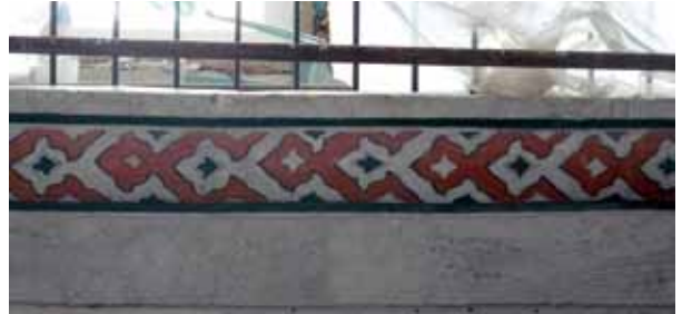
Fotoğraf 10. Gezinti yolu altında ortaya çıkarılan Sinan dönemi kalemîşi bordür deseni.

Gezinti yolu altında bulunan silmede ve beden duvarlarında bulunan birinci sıra pencereleri üzerindeki silmede ortaya çıkarılan orjinal desenler korunarak, bunların eksik kısımları tekrar yapılmıştır. Ortaya çıkarılan desenlerin Mimar Sinan dönemi kalemîşi tezîyatlarında sıkça görülen sülyen ve siyah renkler ile uygulandığı görülmektedir. Bu bölümlerdeki orjinal desenlerde konservasyon çalışmaları yapıldıktan sonra eksik olan bölümler aynı motif ile tümlenmiştir (Foto.10 ve 11).