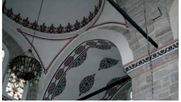
Fotoğraf 9. Kadınlar mahfili kubbe ve tonoz içlerinde uygulanan kalemîşleri.

motiflerden ve Sinan döneminde kullanılan desenlerden faydalanılmıştır (Foto.8 ve 9).