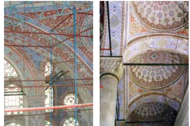
Fotoğraf 5 ve 6. Cami içerisinde bulunan son dönem kalemîşi örnekleri.

Cami içerisinde bulunan son dönem kalemîşi tezyinat çalışmaları ile ilgili olarak ilk önce fotoğraflık tespit çalışmaları yapılmış, daha sonra mevcut olan motiflerin 1/1 stampajları alınarak, envanterleri çıkarılmıştır. Mevcut olan kalemîşlerinin çimento esaslı sıva üzerine sürülen kireç badana üzerine yapılmış olduğu tespit edilmiştir. Son dönem kalemîşleri incelendiğinde, klasik kalemîşi desenlerinin yoğun bir şekilde cami içerisinde kullanıldığı, kubbeden zemin kadar boş bir alan bırakılmadığı görülmektedir. Toprak kırmızı, açık mavi, sarı ve yeşil tonların bolca hakim olduğu kalemîşleri, caminin yapılmış olduğu yüzyıl ile bağlantısız renklerdir. Camide bulunan motiflerin İstanbul'da bir çok camide bulunan ve 1950 ile 60 yılları arasında yapılmış olan motifler olduğu tespit edilmiştir (Foto.5 ve 6).