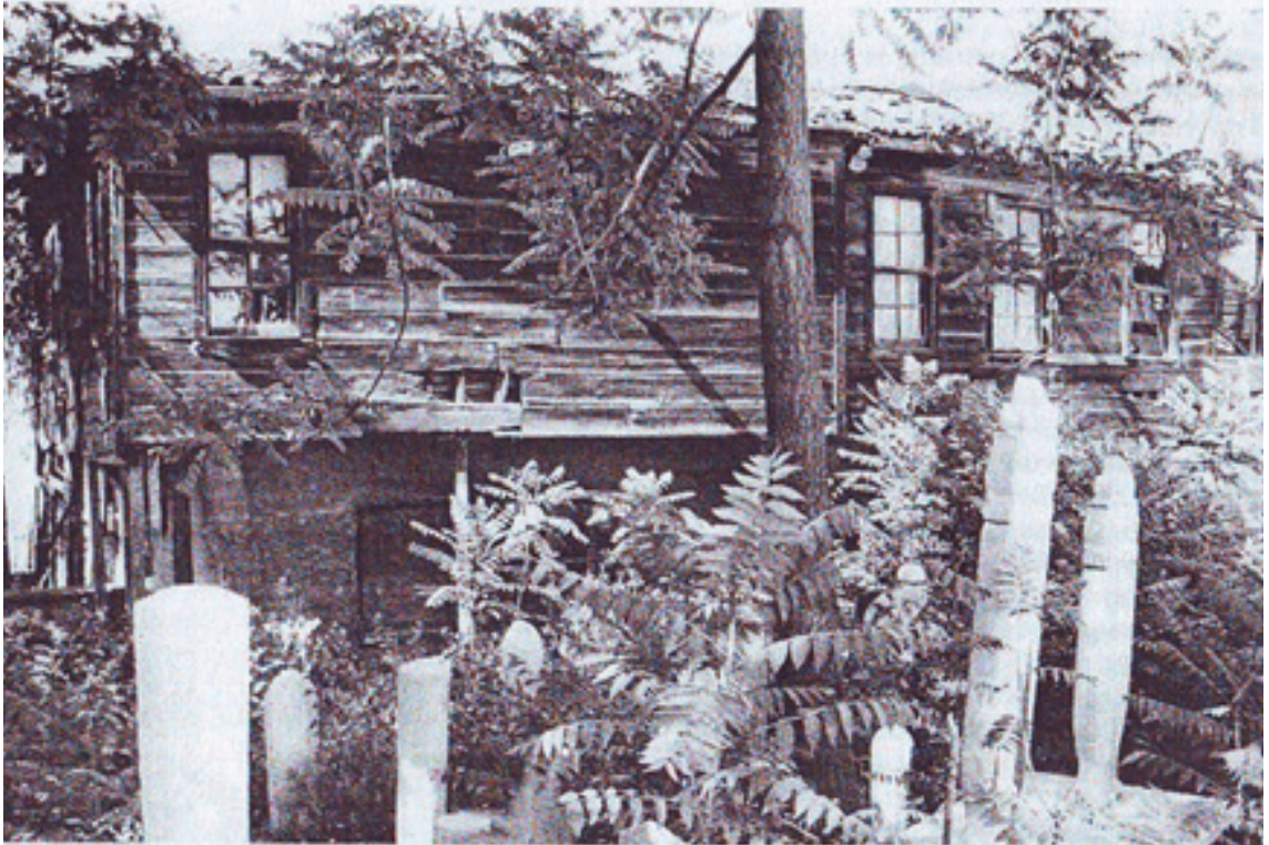
Resim 2. Kazlıçeşme Tekkesinin Restorasyon Öncesi Hali (1994)(Tanman 1997: 115).