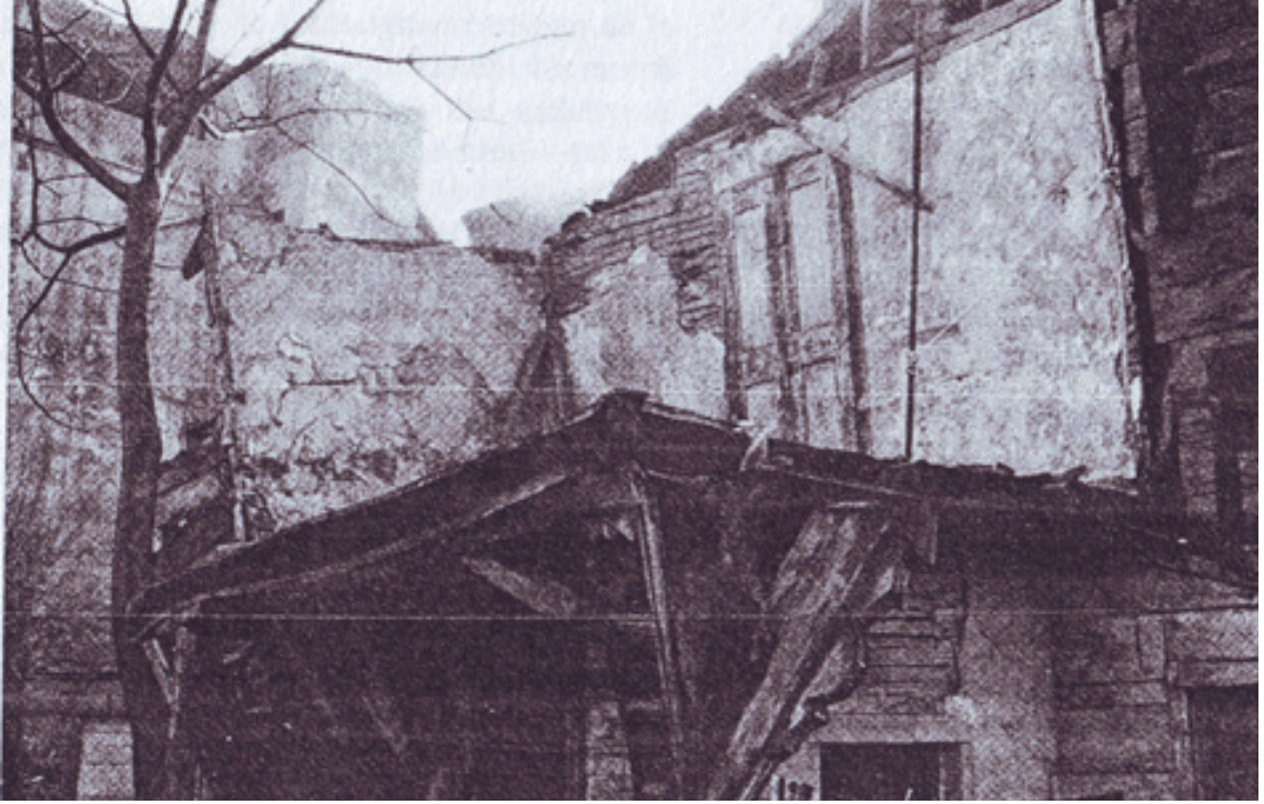
Resim 3.Kazlıçeşme Tekkesinin Restorasyon Öncesi Hali (1994) (Tanman 1997: 118).