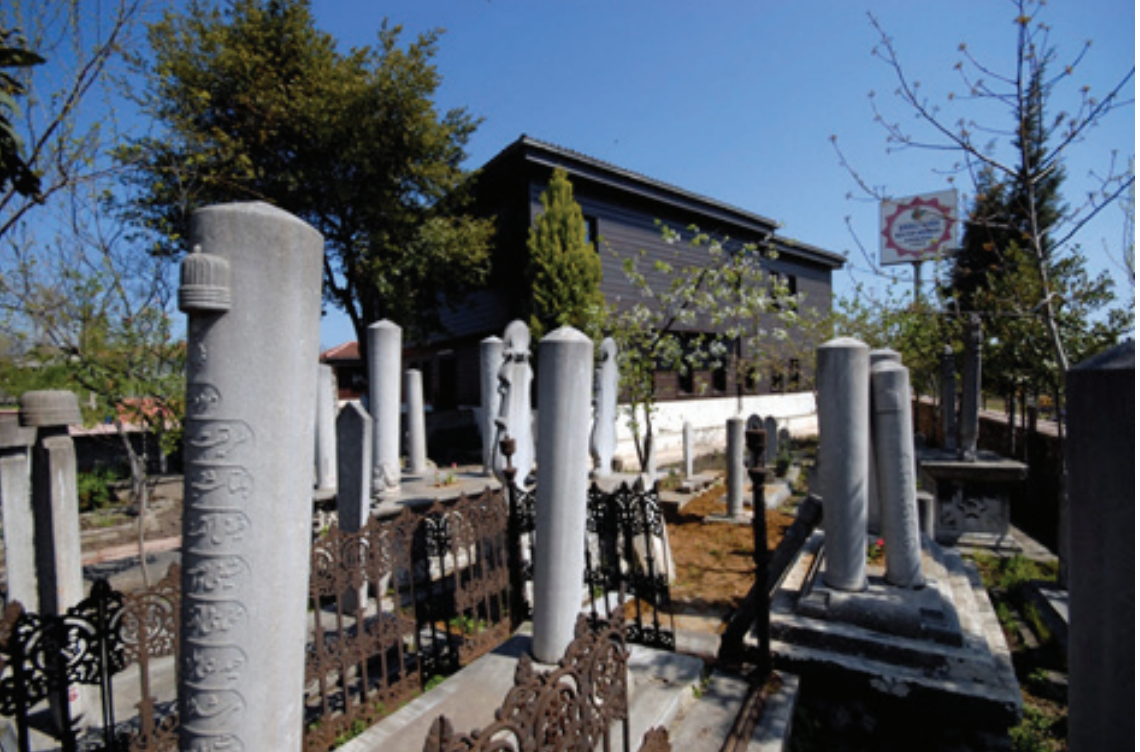
Resim 6.Kazlıçeşme Tekkesi Haziresinin Bugünkü Hali ( http://www.zeytinburnu.com.tr , Erişim 5 Nisan 2013).