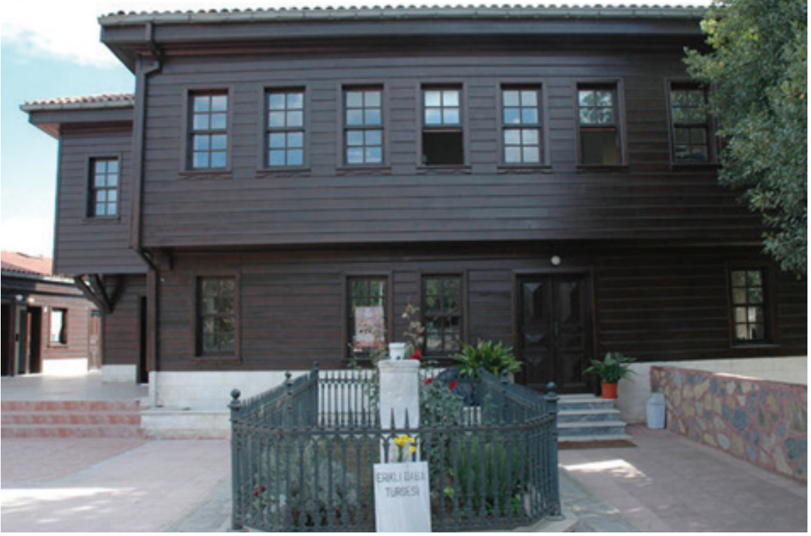
Resim 5.Restorasyon Sonrası Kazlıçeşme Tekkesi ve Eryek (Erikli) Baba Türbesi ( http://www.zeytinburnu.com.tr , Erişim 5 Nisan 2013)