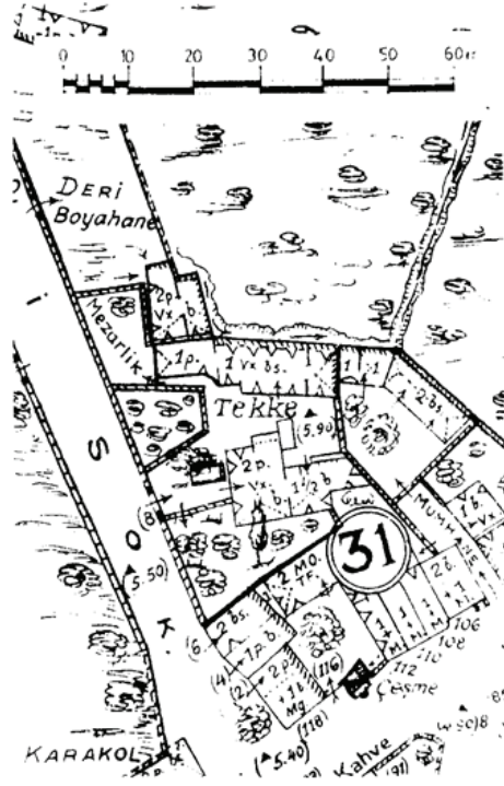
Resim 1. Pervititch'in Eylül 1939 Tarihli Krokinde Kazlıçeşme Tekkesi (Tanman 1997: 113).