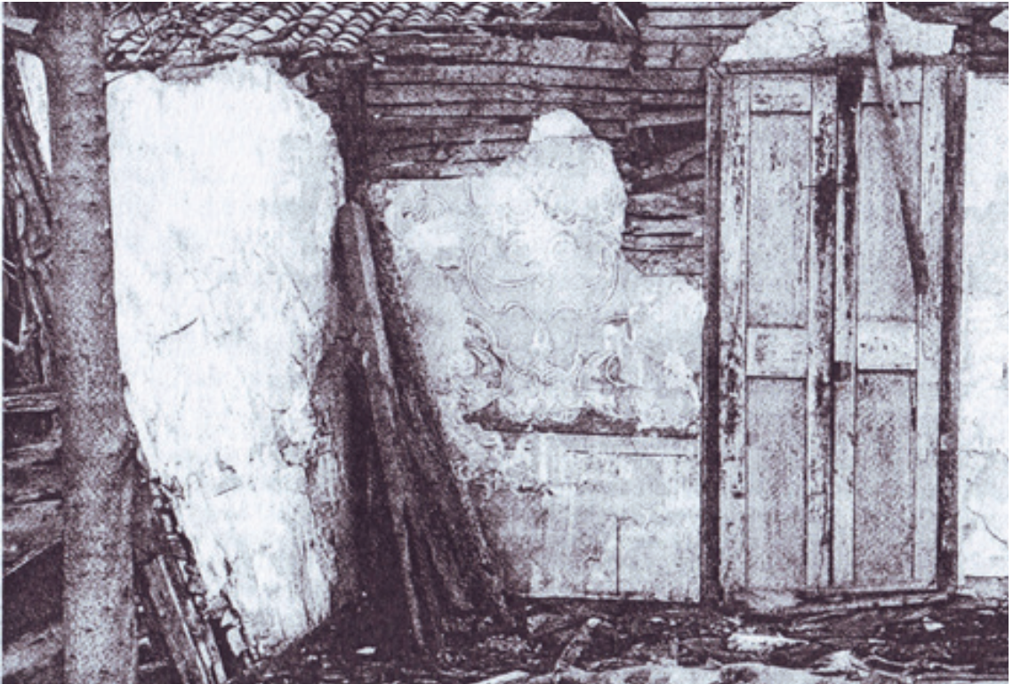
Resim 4.Kazlıçeşme Tekkesinin Restorasyon Öncesi Hali (1994) (Tanman 1997: 118).