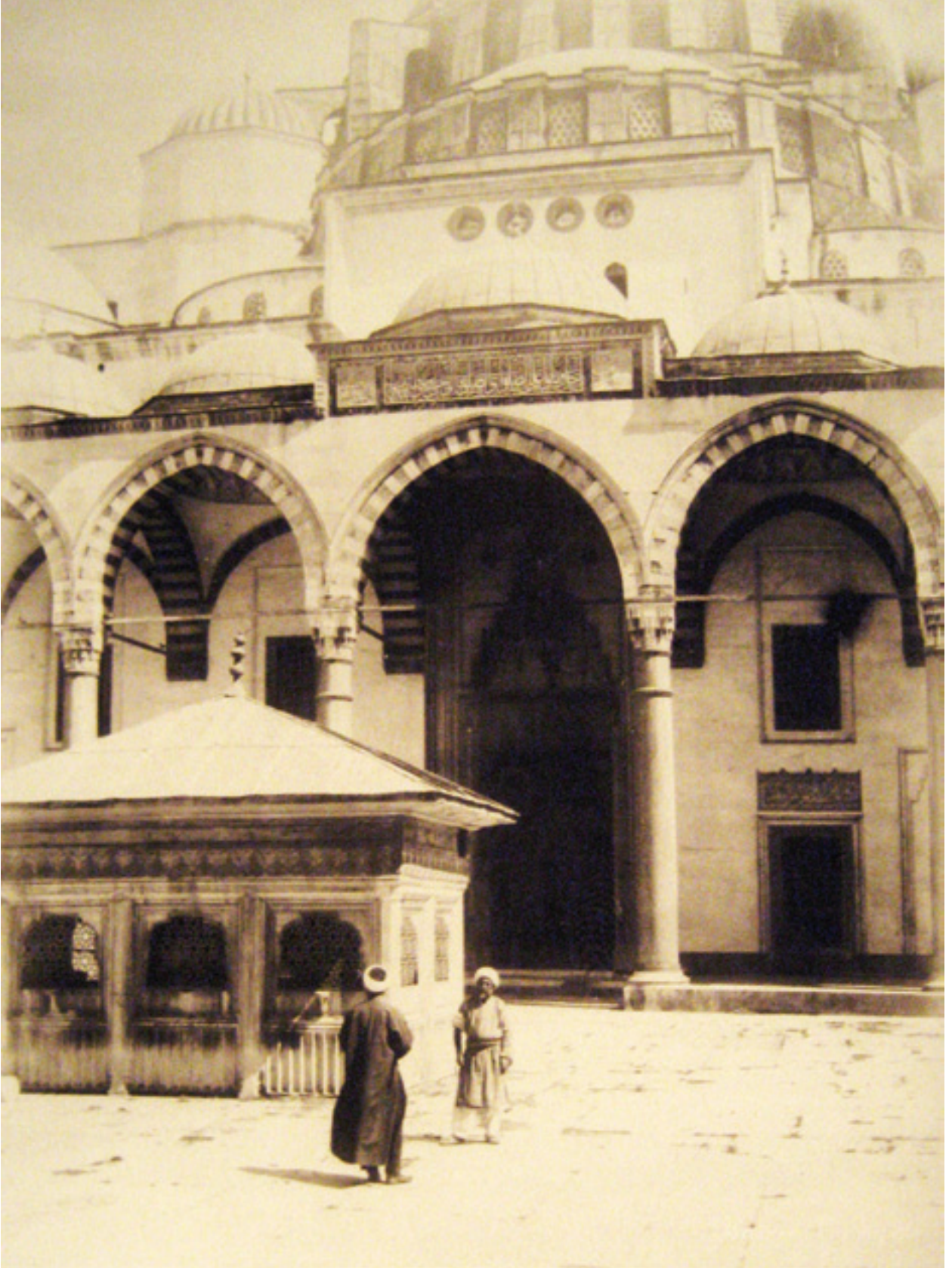
Fotoğraf 1 Caminin şadırvanı ve giriş cephesi 1870 (Basile Kargopoulo, İ.Ü.K. 143864 nolu albüm)

Fotoğrafın Osmanlı'ya gelişinden itibaren dönemin yaşamı çeşitli yönleriyle de kayıt altına alınmıştır. Bu kayıtlarda önemli rolü olanların başında 1843-45 yılları arasında İstanbul ve Anadolu'yu fotoğraflayan kişi, çektiği sekiz yüzden fazla fotoğrafla Joseph-Philbert Girault de Prangey