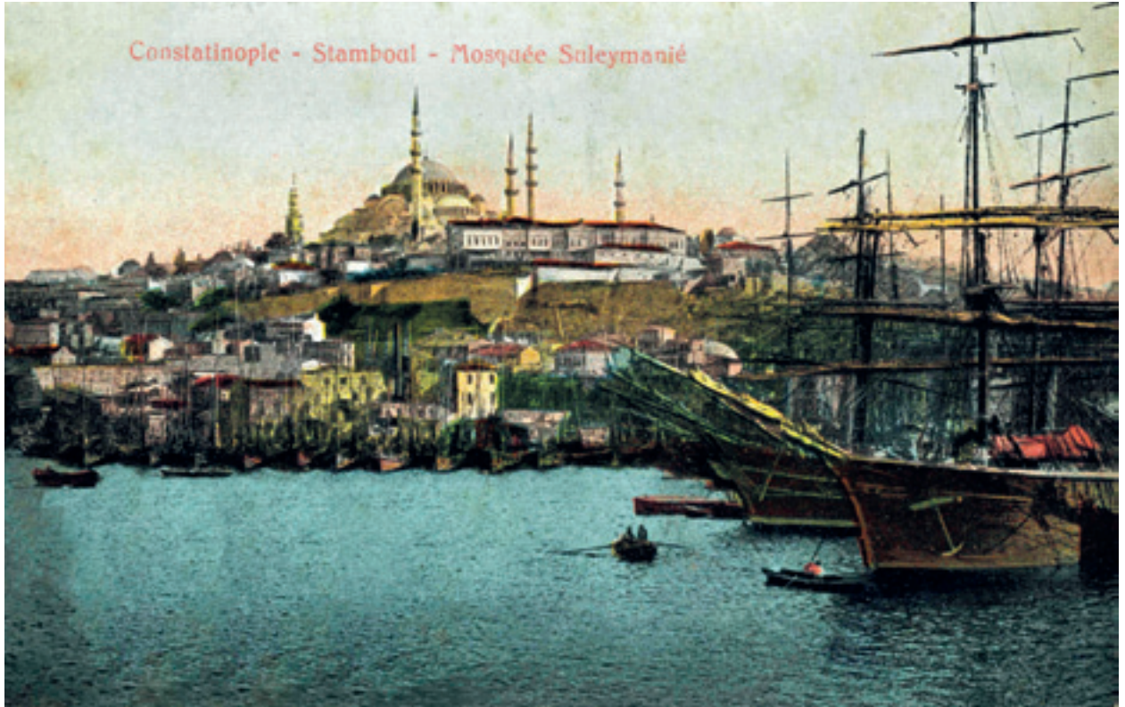
Fotoğraf 7 Unkapanı Köprüsünden Süleymaniye ve Çevresi 1888.