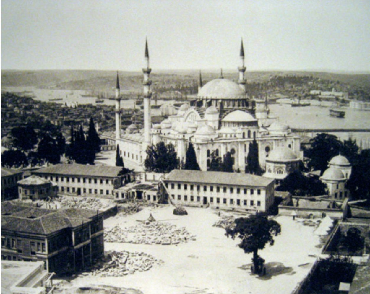
Fotoğraf 3 Beyazıt Kulesinden Süleymaniye ve çevresi 1880