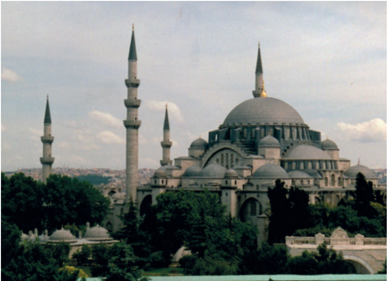
Fotoğraf 36 İ.Ü.Rektörlük binasından Süleymaniye 2007