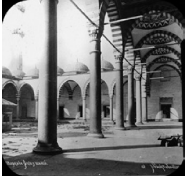
Fotoğraf 12 Camii revaklı avludan bir görünüm 1903 (Sebah & Joaillier, özel koleksiyon).

Süleymaniye'yle ilgili eski fotoğrafların bir çoğu Yıldız Albümleri olarak adlandırılan albümlerde mevcuttur. II. Abdülhamid fotoğrafa oldukça önem vermiş, fotoğrafı çok geniş alanlarda kullanmıştır. Sultan'a sunulan fotoğraf albümlerinden oluşan ve 'Yıldız Saray Koleksiyonu', 'Yıldız Albümleri', 'II Abdülhamid Arşivi' olarak adlandırılan bu koleksiyon, Yıldız Saray Kütüphanesi'ndeki diğer malzeme meyanda Cumhuriyetin ilanından sonra İstanbul Üniversitesi Kütüphanesi koleksiyonuna dahil edilmiştir. İslam Sanat ve Kültürü Araştırma Merkezi (IRCİCA)'nin