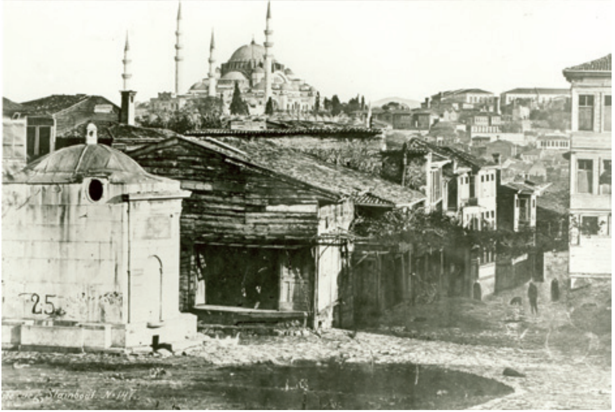
Fotoğraf 10 Bugünkü İ.M.Ç. Atatürk Bulvarı'ndan Süleymaniye 1900 (Guillaume Berggren, özel albüm).