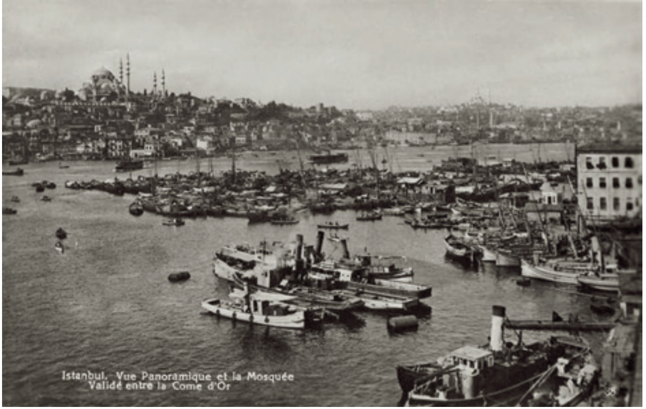
Fotoğraf 15 Galatada'dan Süleymaniye'nin Haliçe bakan yamaçlarını gösteren bir kartpostal 1920 (Anonim).