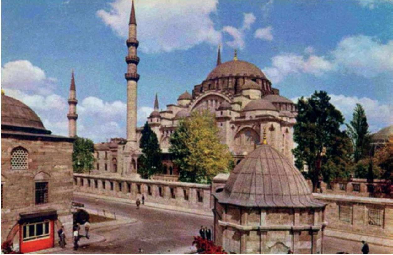
Fotoğraf 34 Hesap Çeşmesi ve Camiyi gösteren kartpostal 1980 (Anonim).

aynı şekilde cami ana kubbesinde ve yarım kubbelerde kemer altlarında yer alan süslemelerin günümüze gelmediğini, gelenlerin de değişerek geldiği bu fotoğraflardan anlaşılmaktadır. Darüşşifa'ya ait fotoğraflarda ise avluyu kapatan çelik konstrüksiyonlu çatı kuruluşunun camlarının kırık, kurşun kaplamaların çoğunun yerinde olmadığı, içinde yer alan havuzun dört bir tarafında yer alan 19. yüzyıl yapımı arslan heykellerinin olduğu ve yapının içinin de oldukça harap durumda olduğu 1936-38 yılına tarihlenen fotoğraftan anlaşılır. Oysa ki, aynı açıdan üç yıl önce çekilen başka bir fotoğrafta ise yapının sapsağlam olduğu görülür. 1938 yılında ise darüşşifada onarım çalışmalarına başlandığını başka bir fotoğrafta tespit etmek mümkündür.