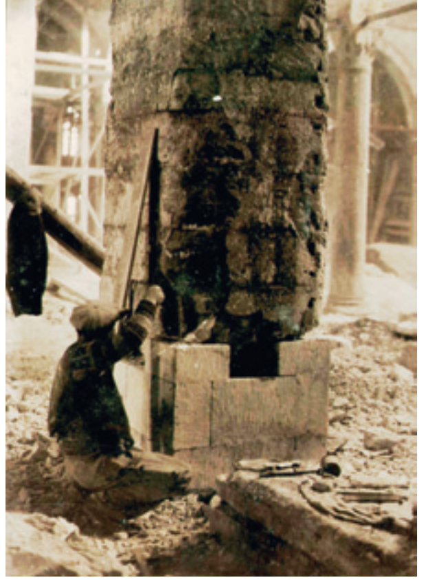
Fotoğraf 24 Darüüşşifa payelerinde onarım faaliyeti 1938

Süleymaniye Külliyesi'nin 1935-1945 yılları arasındaki durumunu ise İstanbul Arkeoloji Müzeleri Encümeni Arşivindeki fotoğraflar ayrıntılı bir şekilde göstermektedir. Encümen, bu yıllarda İstanbul'daki mevcut anıtsal yapıların fotoğraflarını çekip tespitlerini yapmıştır. Vakıflar Genel Müdürlüğü ve İstanbul Bölge Müdürlü-