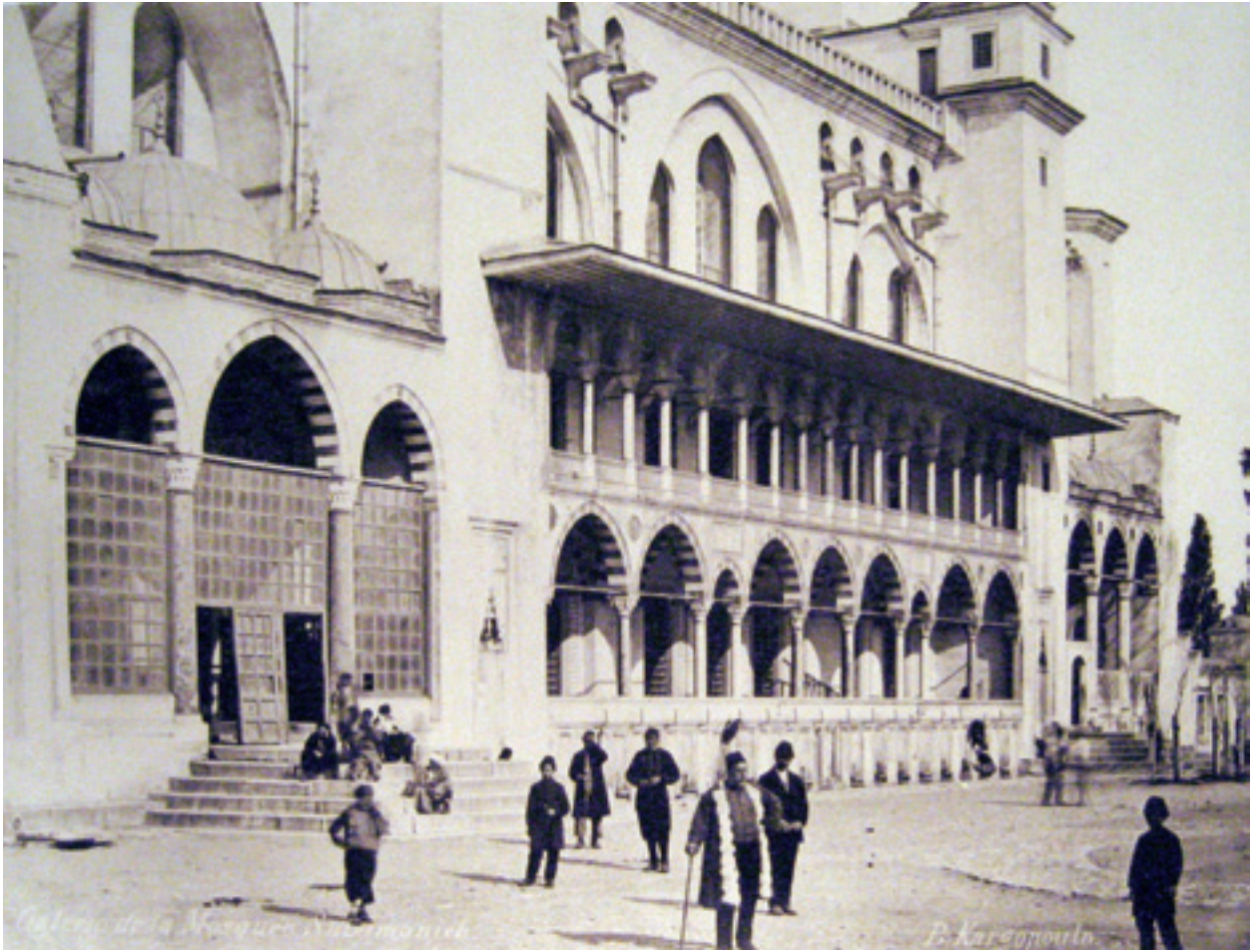
Fotoğraf 4 Cami abdest muslukları 1880, (Basile Kargopoulo Y.A. 90763 ve İ.Ü.K.146951 nolu albüm)