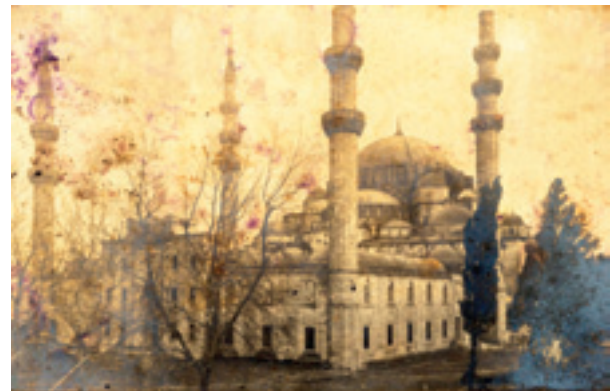
Fotoğraf 21 Caminin genel görünüşü 1936