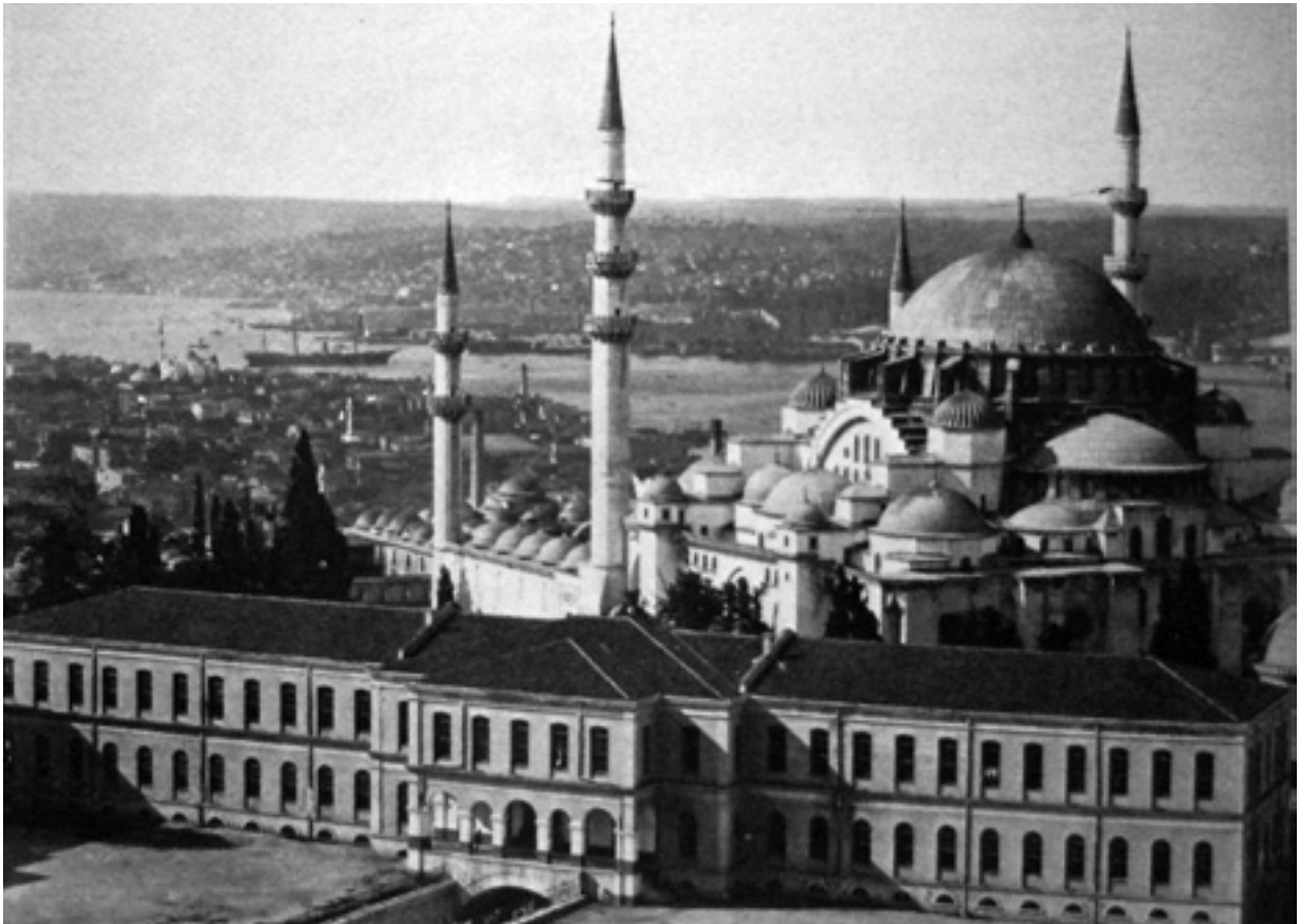
Fotoğraf 5 Beyazıt Kulesinden Süleymaniye 1886 (Gülmez Freres, Y.A. 90450,İ.Ü.K. 140230 nolu albümler)