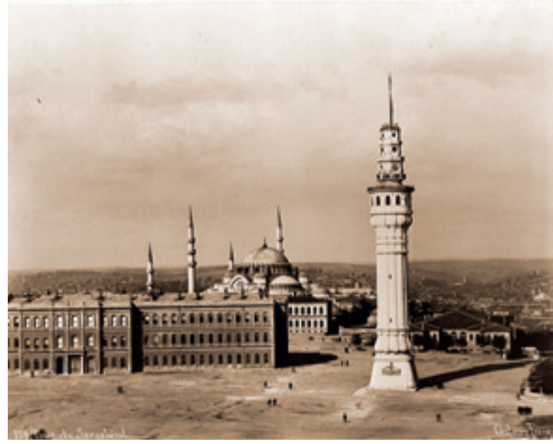
Fotoğraf 8 Süleymaniye Camii'nin içi 1890

İstanbul'un tarihi yarımada silüetine şekil veren Süleymaniye Külliyesi, başta cami olmak üzere, dünyada belki de fotoğrafı en çok çekilen yapılardan biridir. Gerek panora-