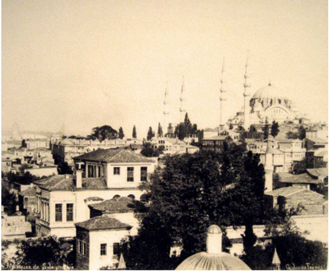
Fotoğraf 6 Süleymaniye Camii 1888-1910.