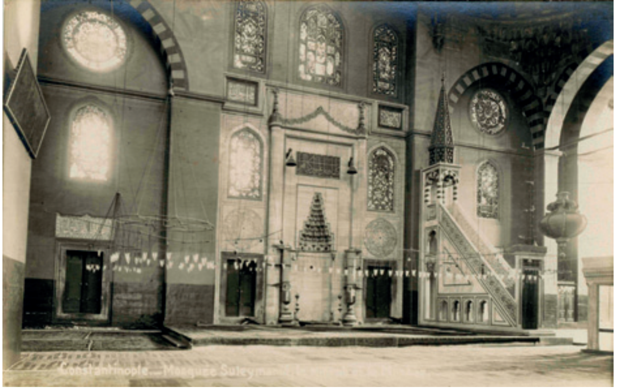
Fotoğraf 16 Cami mihrap ve minberini gösteren bir Kartpostal

İstanbul'un manzaraları cami, türbe, saray gibi anıtsal yapılar yerli ve yabancı fotoğrafçıların en çok sevdikleri konular olmuştur. Yerli fotoğrafçılar ise daha çok Osmanlıların Batı kültürüne ne kadar yakın olduklarını gösteren okul, fabrika, hastane gibi konuların fotoğraflarını çekmişlerdir (Atasoy:15). Hem gezgin hem de yerleşik (stüdyo) fotoğrafçılar İstanbul'un