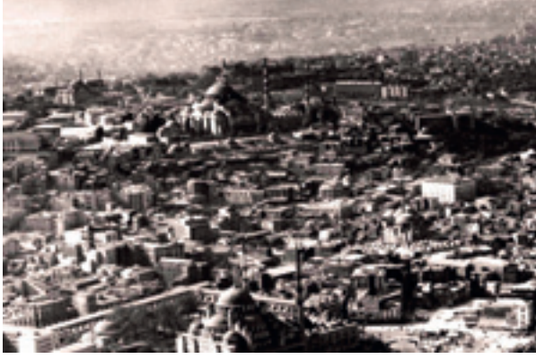
Fotoğraf 17 Yeni Camii üzerinden Süleymaniye ve çevresi 1930.