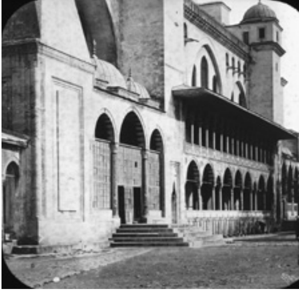
Fotoğraf 11 Camii abdest muslukları 1903.