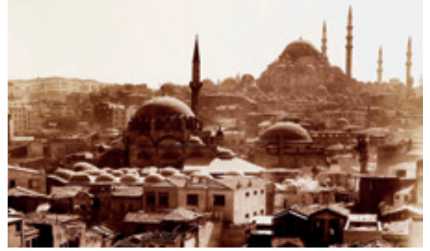
Fotoğraf 30 Rüstem Paşa ve Süleymaniye Camii 1955