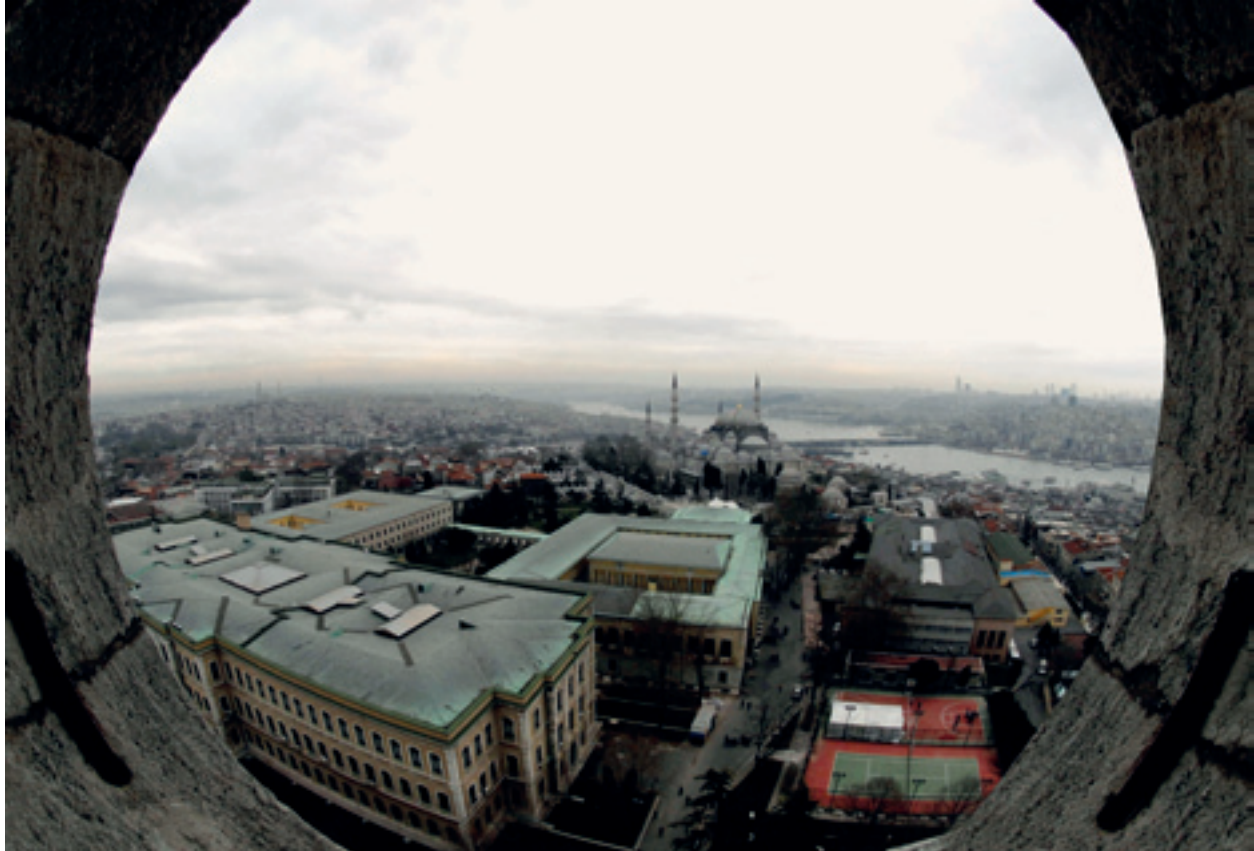
Yangın Kulesi'nden Süleymaniye ve çevresi 2010 (Ahmet Hamdi Bülbül)

Suretin hoş görülmediği İslam coğrafyasında, fotoğrafın kısa zamanda kabul görmesini, dönemin yöneticilerinin fotoğrafa olan ilgisiyle açıklamak mümkündür.