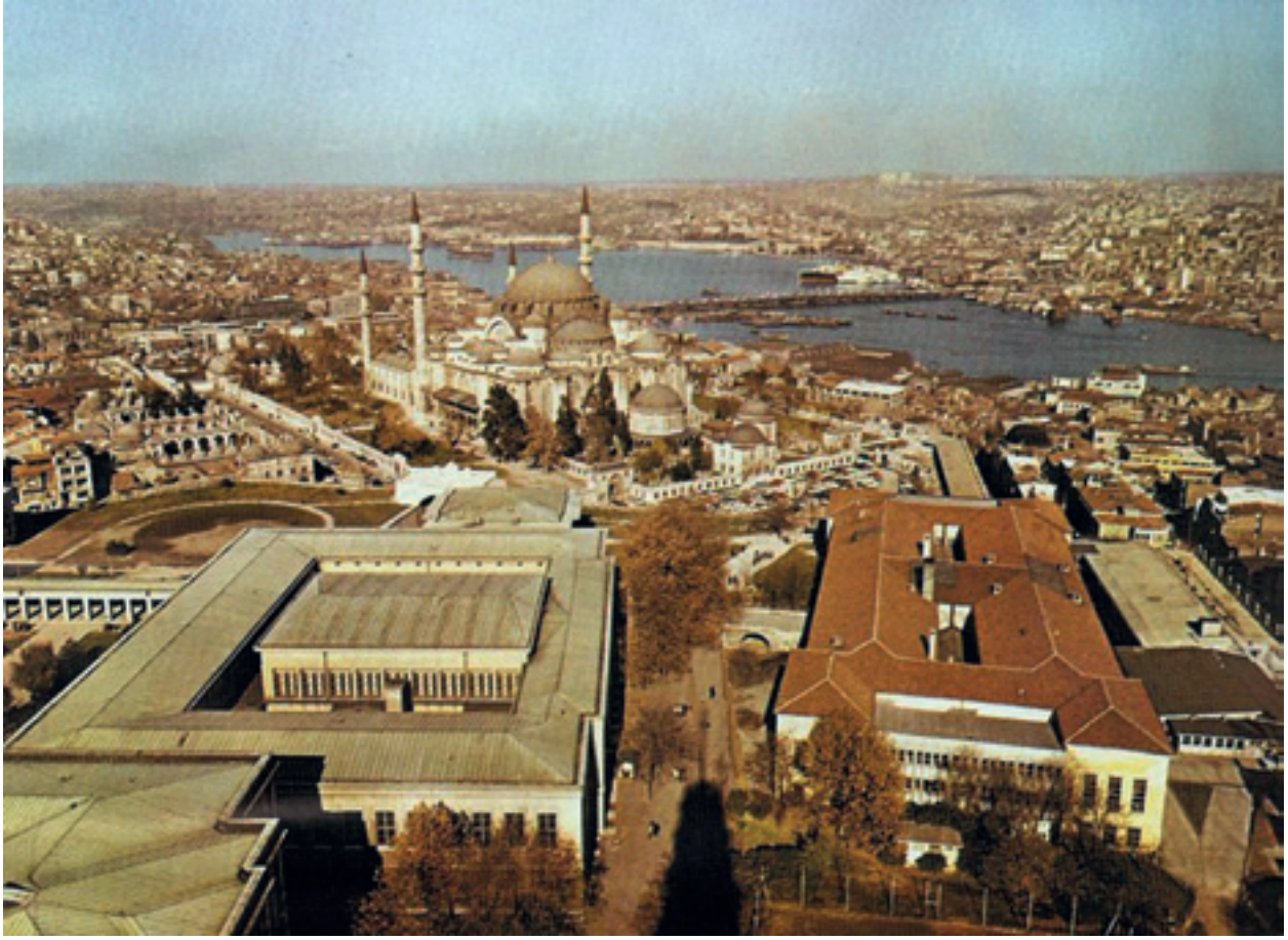
Fotoğraf 35 Yangın Kulesinden Süleymaniye Camii ve çevresi 1983 (Anonim).