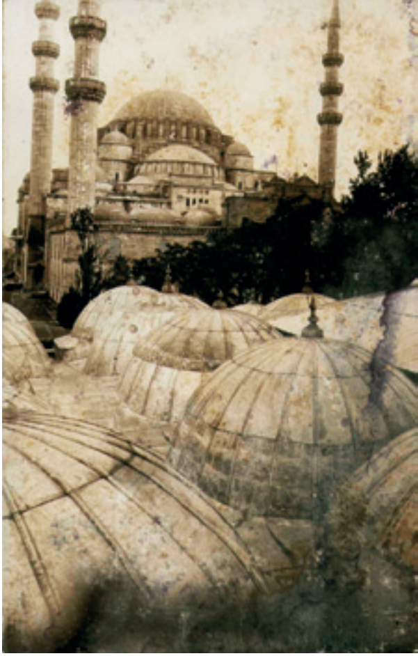
Fotoğraf 23 Darüüşşifa kubbelerinden Süleymaniye Camii 1938

caminin akslarından (Hesap Çeşmesi'nin önünden, Sani ve Evvel Medreselere bakan cephede avlu ile cami ana mekânının birleştiği köşeden) biraz da harim kısmından fotoğraflanmıştır. 1912'li yıllarda havadan da görüntülenen Süleymaniye 1930'lu yıllardan sonra ise farklı açılardan da fotoğraflanmıştır.