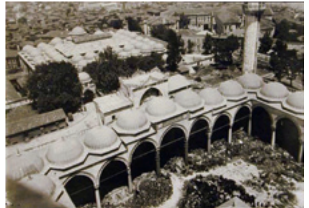
Fotoğraf 31 Üst örtü kurşunları yeniledikten sonra avlu kubbeleri 1960.

ramalarla kapatılmıştır. Yine aynı cephede çörtlenlerin metallerle desteklediği, bu cephedeki küçük kubbelerin alemlü olduğu, şadırvanın üzerinin ise ahşap kuruluşlu kurşun kaplı bir külahlâ örtülmüş olduğu görülür. Yine