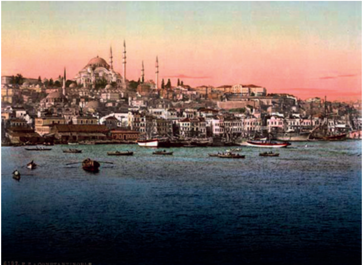
Fotoğraf 9 Galatadan Süleymaniye 1890-1908

mik, gerekse münferit fotoğraflarda yer alan Süleymaniye Külliyesi'nin değişimini, fotoğrafın bu topraklara girdiğinden beri geçen yaklaşık 170 yıllık zaman zarfındaki serüvenini de takip etmek mümkündür. Bu fotoğraflar, sadece Süleymaniye'nin değil, çevresi ve dolayısıyla İstanbul'un da evrimine şahitlik ediyor.