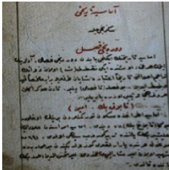
Ek 2: Amasya Tarihiden bir sayfa