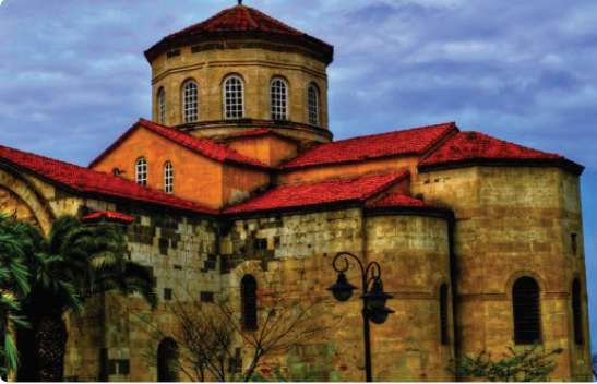
Şekil 3. Trabzon Ayasofya Camii'nin fotoğrafı