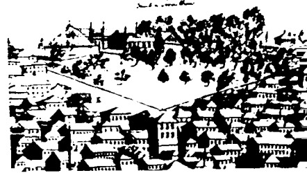
Eski Saray'ın Loos'un 1710 tarihli panoramasından görünüşü