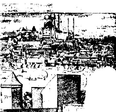
Melchior Lorich'in 1559 tarihli İstanbul Panoramasından ayrıntı

rayıdır ve bu yapıların çoğu Paşa Kapısı olarak da kullanılmıştır 2 . Bu sarayların yalnızca biri, Şah-ı Huban Kadın Sarayı bir kadına aittir. Kimliğini bilemediğimiz bu kadın, nasıl olmuşta Sinan'a bir saray yaptırmıştır. Sâi Mustafa Çelebi'nin saydığı bütün yapıların, günümüz "saray" kavramına girdiğini söylemek mümkün değildir. Örneğin, adı geçen risaleler de her ne kadar Şah-ı Huban Kadın Sarayı denirse de, Sinan bir kaydında Hane-i Şah-ı Huban Hatun demekle bu yapının gerçek anlamını ortaya koymaktadır (Bkz.. Şah-ı Huban Kadın Sarayı).