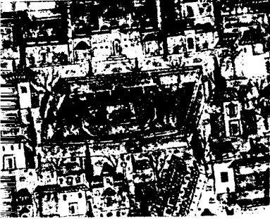
Eski Saray Matrakçı Nasuh'tan