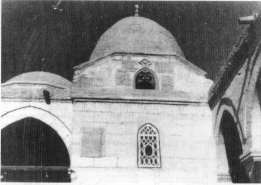
Res. 4: Kahire Hadım Süleyman Paşa Türbesi.