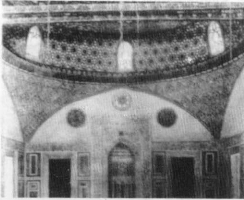
Res. 2: Kahire Hadım Süleyman Paşa Camii kible eyvanı ve yarım kubbesi.