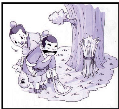
图 4 《拷打羊皮》 与(3)相对应的插图