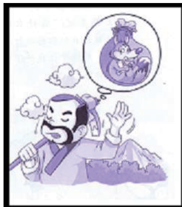
图 1 描绘了“东郭先生”牵着毛驴的样子，由此能够理解“毛驴”“牵”所要表达的意思。同时，图 2 明确显示“口袋”指的是什么。而前面所提到的(1)至(4)所使用的插图如下所示。