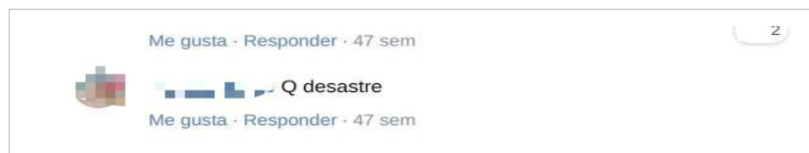
Figura 1. Publicación A.

El cuerpo de contenido de la primera publicación seleccionada (2018.1) es un texto político y crítico de un delegado sindical, autor de otras publicaciones en el grupo y con mucha repercusión dentro del mismo. De los/as tres participantes de la publicación, uno es el autor/iniciador y las otras dos participantes podrían encuadrarse según Ponce Rojo et. al. (2012) bajo la denominación de apoyadores sin fundamento, ya que no aportan pruebas ni argumentan sobre el contenido de la publicación, sólo apoyan las palabras del autor (Figura 1).