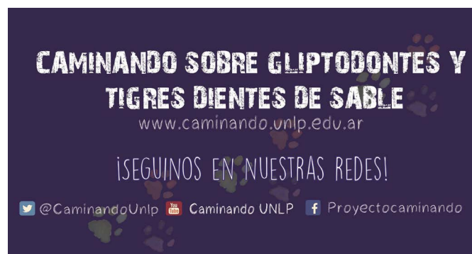
Caminando sobre gliptodontes y tigres dientes de sable en redes sociales

individuos, ponemos en juego a los fósiles como bien patrimonial. Concluimos que un objeto cobra valor patrimonial cuando se comparte, es reconocido y sentido como propio por la comunidad. Esto es la base y razón por la cual las personas nos sentimos parte de un conjunto mayor que llamamos sentido de pertenencia; que puede ser local, nacional e incluso mundial. Así, el patrimonio juega un rol importante en nuestra identidad y su fuerza no proviene del objeto, sino de las personas que se apropian de él (SALGADO-AHUMADA; MONTERO; IACONA et ál., 2017). Apropiamos del patrimonio es hacer parte de nosotros aquello que tiene un valor para la comunidad, entendiendo que no todos tenemos los mismos roles u obligaciones. Por ejemplo, los paleontólogos tienen responsabilidad en el descubrimiento, conocimiento, resguardo y divulgación de los fósiles; las instituciones deben trabajar junto a la comunidad local para darle valor educativo e identitario y velar por su cui-