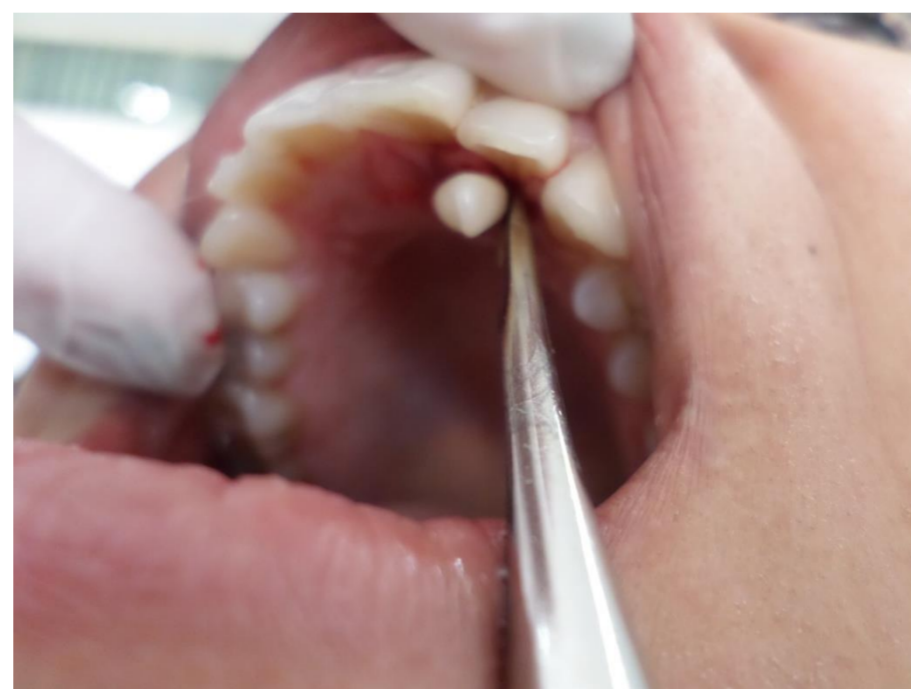
Fig. 4 Exodoncia con elevador