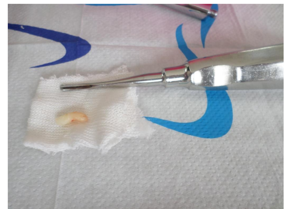
Fig. 5 mesiodens extraído.