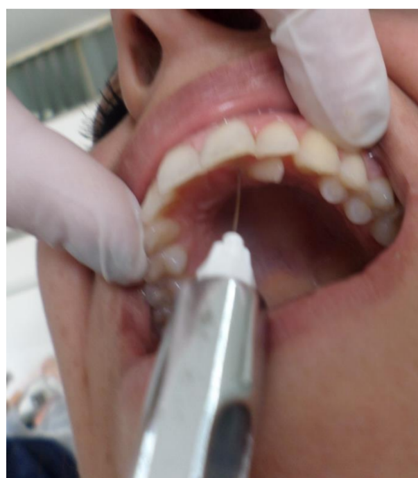
Fig.3 Anestesia infiltrativa