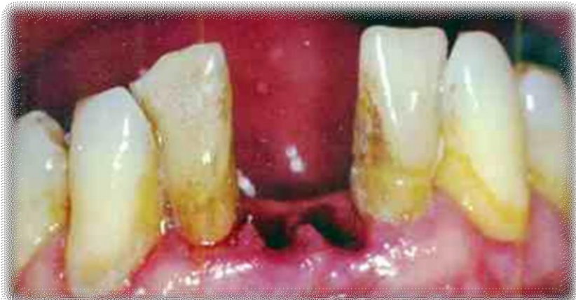
Exodoncia piezas 31 y 41

Posteriormente se acondicionan las piezas extraídas con Raspaje y Alisado Radicular, Endodoncia Retrógrada y Sellado Apical