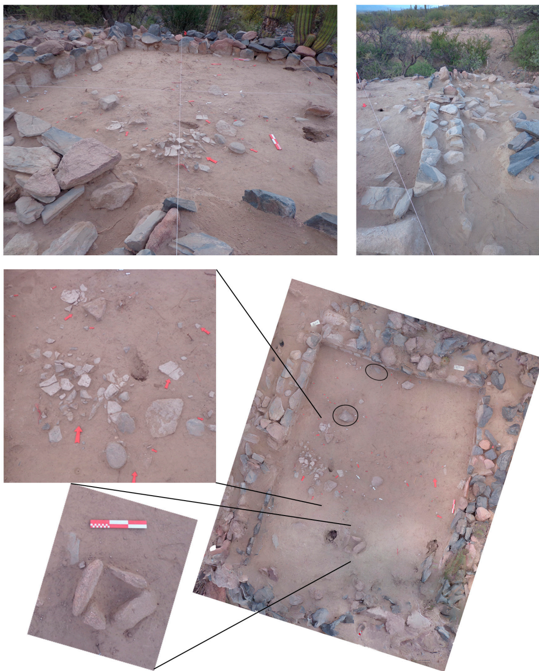
Figura 3. Vistas de la excavación en área extendida en la E66 y modelo fotogramétrico del Decapado 6 (PhotoScan). Se indican con óvalos dos áreas de combustión (Rasgos 2 y 4). Detalles de estructura de poste (Rasgo 1), olla ordinaria rota in situ (Rasgo 3).