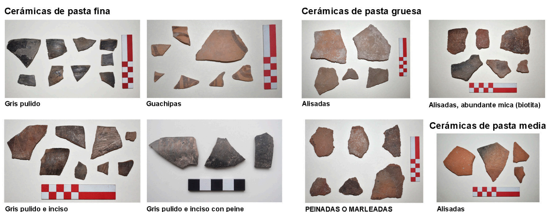
Figura 4. Ejemplos de fragmentos cerámicos recuperados en las excavaciones de la D28, Sector Conoide Norte, El Colorado.