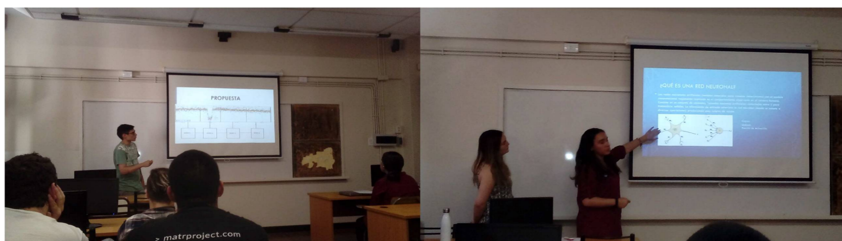
Figura 1. Seminarios de alumnos investigadores acerca de sus temas de trabajo.

carácter científico como las competencias vinculadas a la expresión oral, necesaria para expresar y comunicar correctamente los trabajos, se ejercitan a su vez en la asignatura electiva Computación Paralela, brindada por los directores del LICPaD, en donde se brindan lineamientos y recursos para que los alumnos desarrollen estos aspectos de la comunicación.