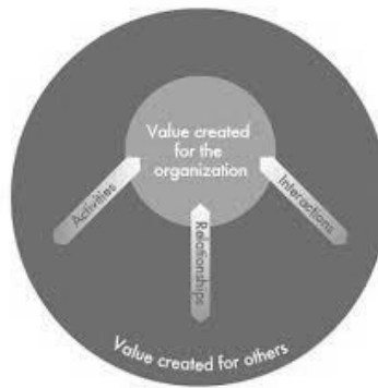
Figura 1: Valor para el IIRC