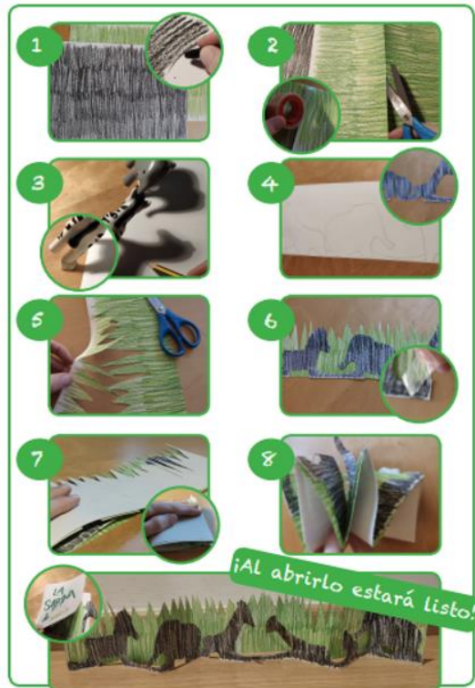
Ilustración 6: Secuenciación de los pasos para la construcción del libro con animales

Para que la actividad fuera más atrayente, se realizaron varios ejemplos de mayor y menor complejidad que sirvieran de modelo a aquellos que se animasen a llevar a cabo esta actividad en casa. De entre los ejemplos realizados, señalamos un libro con animales de la sabana que pensamos que podría ser interesante y atrayente debido a su parecido con el cuento y película Disney de El rey León , ( Ilustración 7 ) empleando cartulinas de colores y efectuando planos diferenciados con siluetas más complejas. Por otra parte, dada las posibilidades que nos ofrecía esta actividad virtual, también se diseñó un vídeo 2 corto en formato stopmotion colgado en YouTube con enlace directo desde la actividad generada y realizado con las sombras proyectadas de pitufos de juguete (Lucero, 2016).