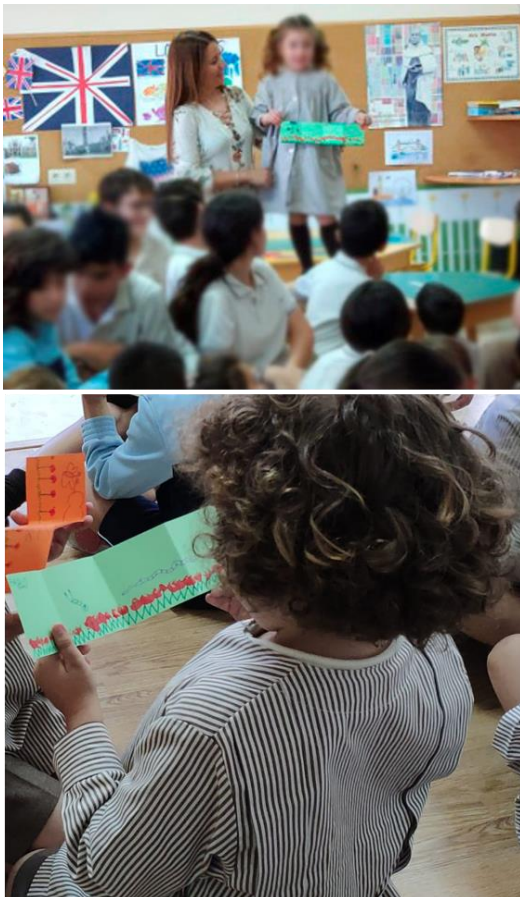
Ilustración 2: Alumnos de primaria y secundaria participando en la actividad del Libro acordeón. CEP El Carmelo de Granada/ Fotografía: Ana María López Montes.

Una de las variantes que en ocasiones se ha introducido en esta actividad y que ha resultado muy positiva, ha sido la de incorporar a la tarea a un grupo mayor del mismo colegio (de 1º a 4º ESO). El objetivo en este caso ha sido el de implicar a los alumnos de esta etapa con los más pequeños, de manera que asistiendo a la primera parte de la actividad teórica en círculo y atendiendo a las directrices de las personas que presentan la actividad, son ellos los que se encargan de ayudar a los más pequeños en la realización de su libro acordeón. Esta forma de trabajar hace responsables de manera indirecta al grupo más mayor (ESO) de los más pequeños (infantil) resultando con ello, el intercambio de conocimiento y un excelente comportamiento por parte de ambos grupos ( Ilustración 2 ).