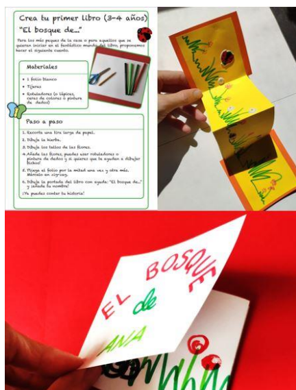
Ilustración 5: Secuenciación de los pasos para la construcción del libro bosque de... y libro acabado.

Una vez terminado, se invita a que cada persona que lo realice, personalice su propio cuento y su propio bosque ( Ilustración 5 ).