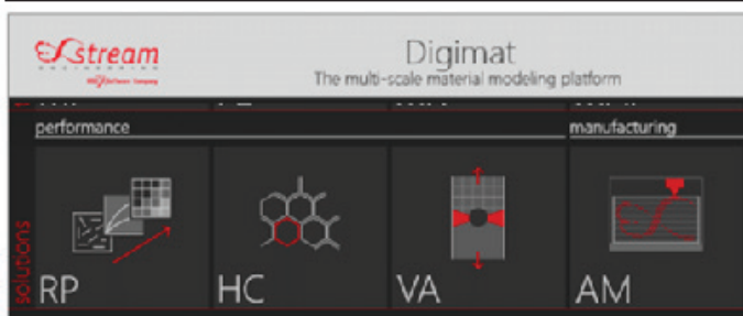
2. ábra. Digimat AM szoftvercsomag moduljai

Lehetővé teszi a mérnökök számára a nyomtatott darab vetemedésének, a hőmérséklet viszonyoknak és a maradó feszültségeknek a vizsgálatát a nyomtatási paraméterek és az anyagválasztás függvényében. A Digimat AM szimulációk segítségével a nyomtatási beállítások optimalizálhatók, még a fizikai nyomtatás előtt, például a megfelelő vetemedés kompenzáció azonosításával. A szoftver egyszerű és hatékony munkafolyamatot biztosít, a nyomtatási projekt definiálásától kezdve, a különböző gyártási paraméterek beállításával, a szimuláció beállításával és az eredmények kiértékelésével (2. ábra).