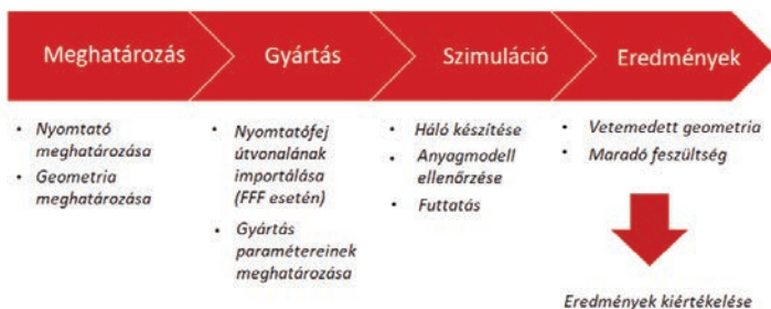
3. ábra. Digimat-AM szimuláció főbb lépései

A Digimat AM által számított eredmények jó egyezést mutatnak a valóságban kinyomtatott kocka vetemedésével. Az alsó szintekben bekövetkező változásokat karima hozzáadásával lehet csökkenteni, vagy megszüntetni, mivel azzal növelhető az alap