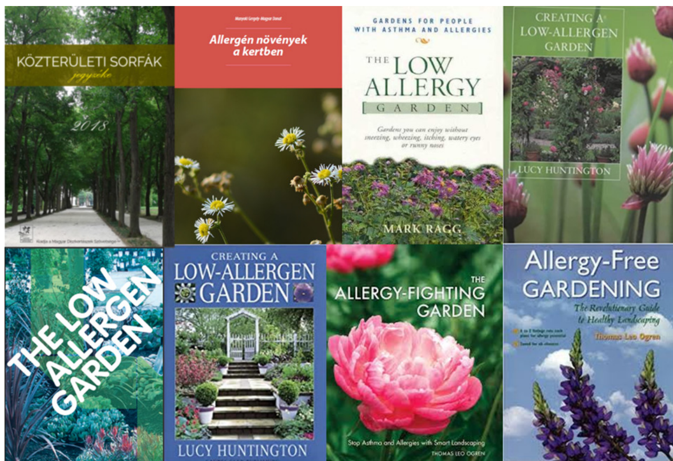
1. ábra: Az allergénmentes zöldfelületek kialakítására vonatkozó irodalom nagyon népszerű, ezt mutatja a számos e témában megjelent kiadvány

időnként cikkek is megjelennek e témában, valamint külföldi honoldalakon is található erre vonatkozó ajánlásokat 3,5,6,7,14,16,20,21 .