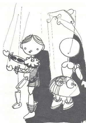
8. kép: Tankönyv-illusztráció (Forrás: Balogh-Tarbay-Montágh- Hollós-Séd-Bakkay-Polcz, II. kötet 79.)

A fejezet rámutat arra, hogy az a legokosabb, ha játékos tevékenység közepette és már kora gyermekkorban megkezdődik a világot esztétikusan alakító ember képességeinek megalapozása, fejlesztése, nehogy elkéssünk. Tudatosítja, hogy a gyerekek érzetvilága (Báron László szavai), akár ha otthonról hozták, vagy éppen az óvodában szerezték, rendkívül gazdag . A kézimunka foglalkozásokon így aztán könnyen bevonhatók a köznap anyagokból való tárgyak, formák készítésébe. Ha az óvopedagógus abba a játékba is beleviszi a gyerekeket, hogy az ember- és állatfiguráknak lötyögjenek a végtagjai, mozgatható