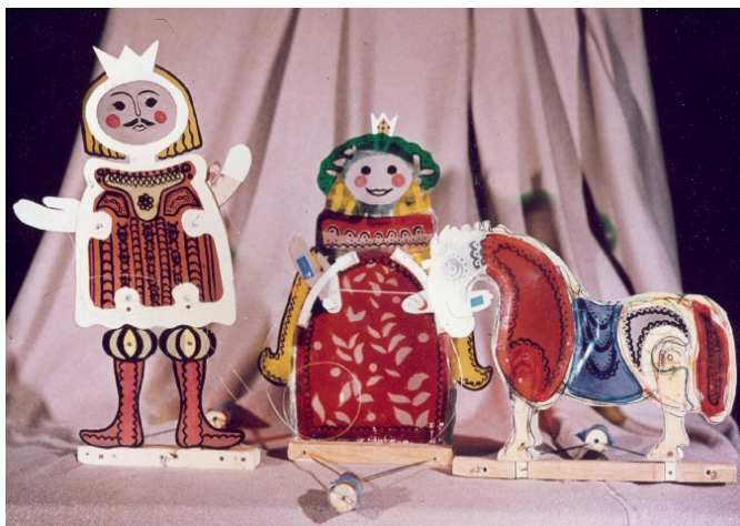
10. kép: Színes árnyfigurák – mechanikákkal

XIII. századi kínai dráma bábadaptációjához készült bábok (Báron László hagyatéka)