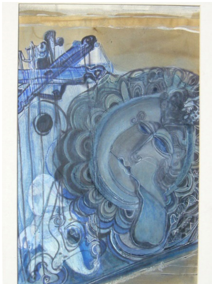
1. kép: Báron László: Életre kelés (gouache, pasztell)

műbe könnyedén átúszó motívumokat, a sokat sejtető szimbolikát, a még többet mondó üzeneteket. Mindezt humorral, játékosággal átítatva. Igazán kár, hogy az ilyen és ekkora organikus oeuvre ma a jelentőségénél fénytelenebb életet él. De létezik: 2162 Örbottyán, Rákóczi u. 82/3.