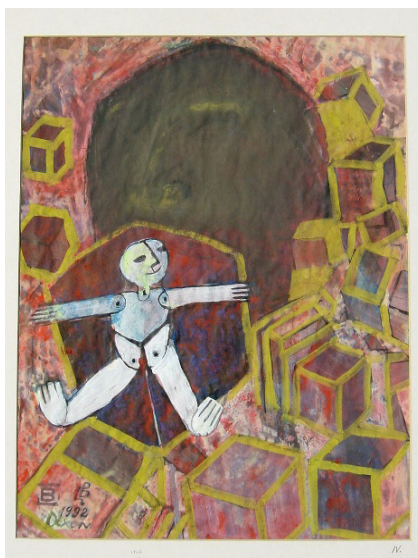
3. kép: Báron László: Tétován (gouache, pasztell)