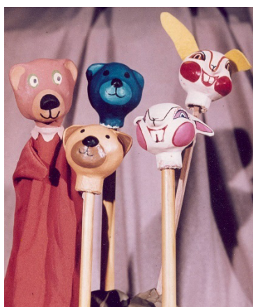
7. kép: Bábfejek a tanári szobában