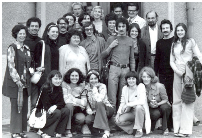
4. kép: Az amatőr Ciróka bábegyüttes

Az ipari üzemből – munkahelyet váltva – a kecskeméti Iparitanuló Iskolában szakismeretet és szakrajzot kezdett tanítani. Ugyanitt a gödöllői élmények hatására – asztalosokból, varrónókból, fodrászokból verbuválódott – bábszakkört indított. Eközben Egerben rajztanári diplomát szerzett (1971). A bábművészet beszippantja, s mindez a nyolcvanas évek végéig kitart. Közben az együttes az óvónőképző hallgatóival, a Kodály zeneiskola növendékeivel színesedik, s nívóvá nemesült nevet kap: Ciróka.