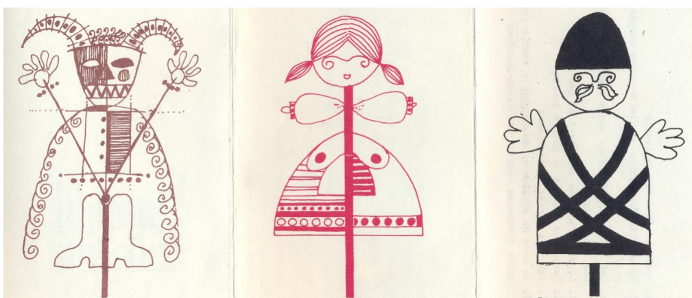
11. kép: Dekoratív figura rajzok (Báron László munkái)