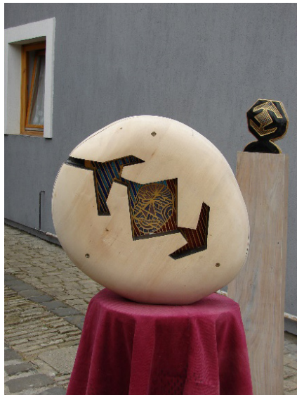
2. kép: Arlecchino szeme (plasztika, aszúrozott zománcbetéttel)