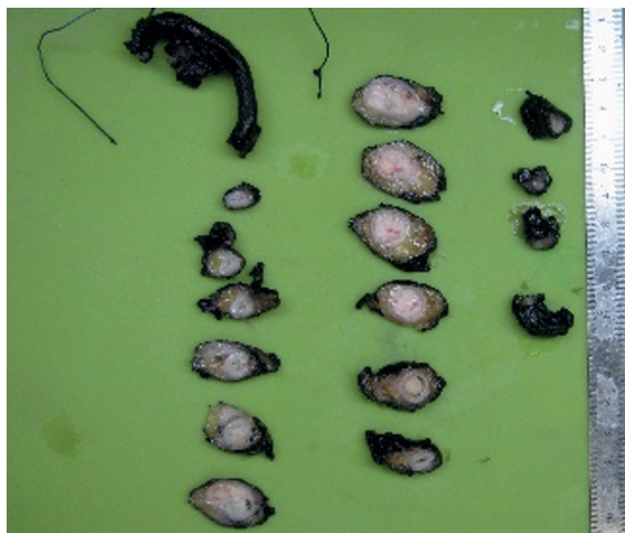
1. ÁBRA: IUP MAKROSZKÓPOS KÉPE

sulnak. Ezek a hámstruktúrák centrálisan érett urothelialis hám-sejteket, míg a perifériás, széli részeken sötétebb festődésű, paliszádszerűen elrendeződött basalis sejteket tartalmaznak. A glanduláris variánst úgy definiálták, hogy ez esetben a tumor urothelialis sejtfészkekből áll, amelyek urothelialis sejtek által bélelt pszeudoglanduláris üregeket, vagy nyáktermelő sejtekből álló valódi mirigyeket tartalmaznak. A glanduláris variáns nem talált a szakirodalomban széles körű elfogadásra, mivel morfológiai megjelenése átfedést mutatott a „florid cystitis glandularis” megjelenésével (4).