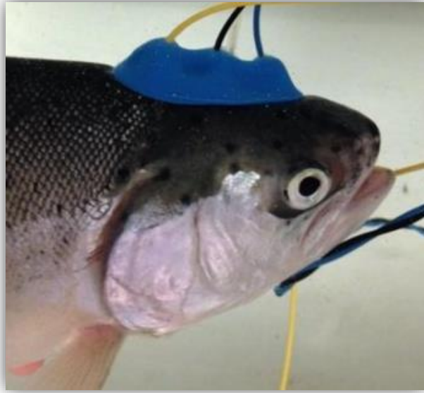
Figur 2. En nyligen utvecklad metod för att mäta EEG på fisk med hjälp av elektroder inrymda i en sugkopp som sugts fast på fiskens huvud.

Behovet att med hjälp av forskning tillhandahålla faktabaserad information om hur de olika bedövningsmetoderna som används för regnbåge och fjällröding påverkar förlusten av medvetande, samt vikten av att detta görs vid alla aktuella temperaturer har påtalats av EFSA (2009c). Därefter har vikten av att frångå användningen av synliga indikatorer på medvetande vid utveckling och verifiering av olika bedövningsmetoder belysts i studier av regnbåge (Bowman et al. , 2019), fjällröding (Gräns et al. , 2016; Sandblom et al. , 2012) och atlantlax (Lambooj et al. , 2010). I litteratursammanställningen har vi trots detta valt att inkludera även studier som endast undersökt visuella tecken på medvetande men vi vill vara tydliga med att dessa metoder endast kan användas för att identifiera huruvida en undersökt metod inte uppfyller kraven på en etiskt försvarbar avlivningsprocedur, inte för att bevisa att en metod faktiskt fungerar.