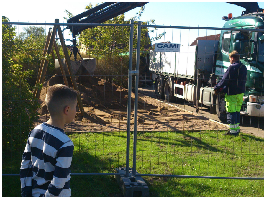
Barn är ofta de stora användarna av utemiljöer, med ett intresse för konkreta förändringar, men parkförvaltningars anpassning efter barn ser mycket olika ut.

Generellt finns en önskan om att öka barnvänligheten och även barns deltagande inom parkförvaltningen i båda länderna, men flera utmaningar förknippas också med det. Be-