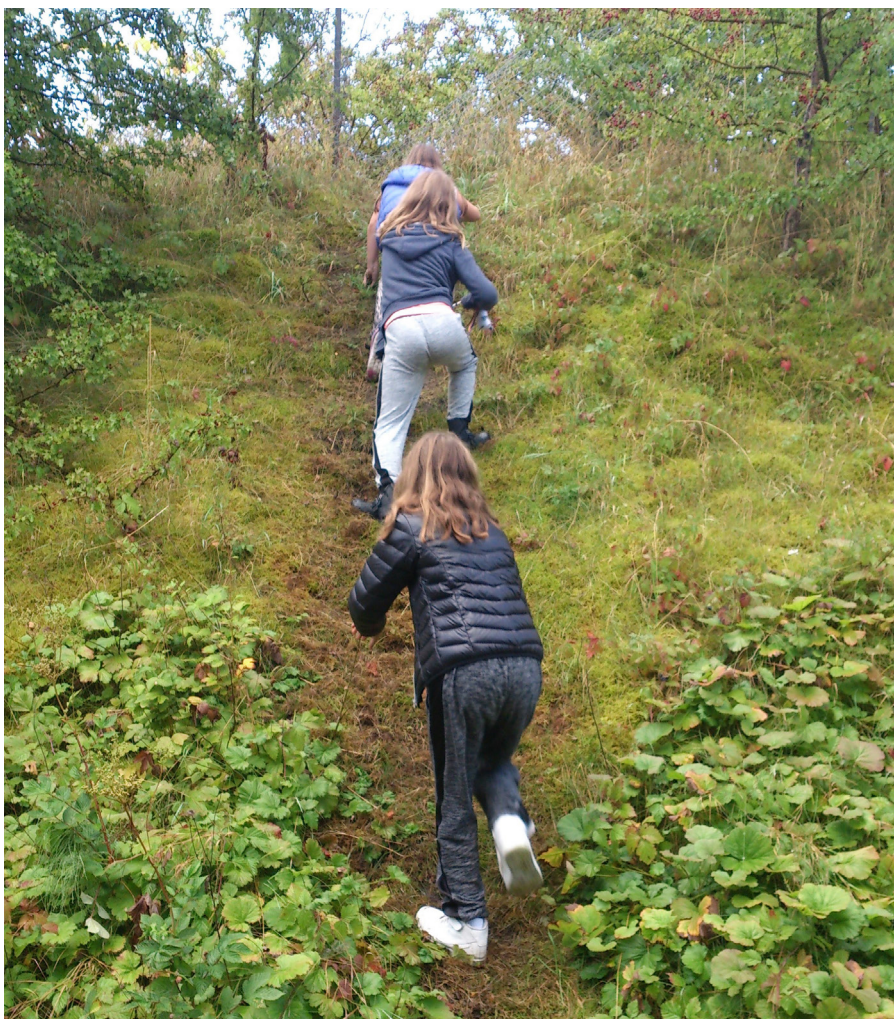
Generellt består barnvänliga utemiljöer av strukturer som främjar rörelsefrihet och en mängd varierade och intressanta platser.

För att verkligen kunna utveckla barnvänliga miljöer genom förvaltning behövs specifik kunskap om barn och utemiljö. En grund kan vara vikten av dels strukturer som främjar rörelsefrihet, dels platser och element som är