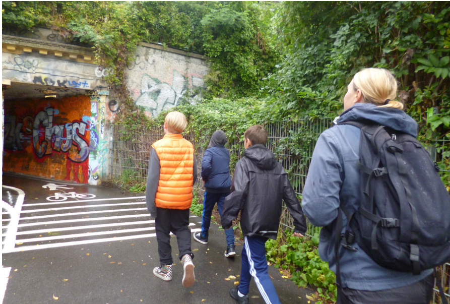
Barnledda promenadintervjuer är en metod som ofta fungerar väl för att fånga barns egna perspektiv på sin utemiljö.

strategiska mål sätts upp, på den taktiska nivån kan tjänstepersoner ta fram planer och utveckla arbetsätt och på den operationella nivån utförs skötsel, underhåll och utvecklande insatser i praktiken. Alla tre nivåer kan ha stor betydelse för barnvänlighet, inte minst om de är väl sammankopplade i förvaltningsarbetet.