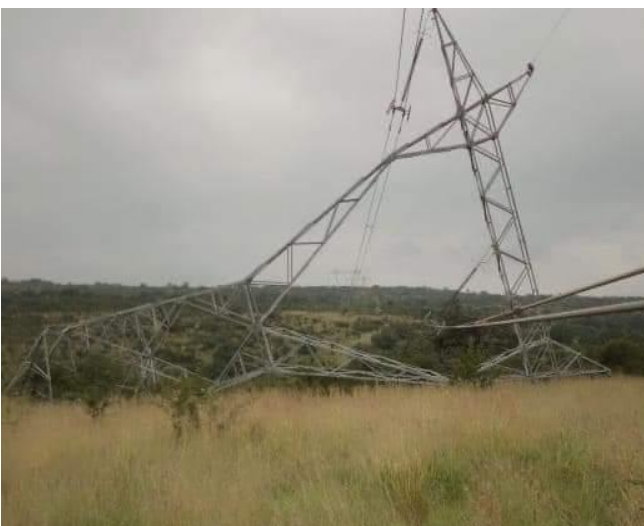
Figura 3: Torre de energia vandalizada (topo) e manutenção da rede de rede (abaixo)

Em toda a diversificada geografia de Moçambique, as maiores cidades de Maputo, Matola, Nampula e Beira têm registado um aumento no número de subestações e linhas de distribuição sobrecarregadas, causando mais quedas de energia. A capacidade da EDM para atualizar, monitorar e manter sua infraestrutura para suportar a demanda crescente em todas as partes do país (sul, centro e norte) é limitada, em parte devido à distância entre as fontes de geração de eletricidade (incluindo, mas não se limitando a, Hidroelétrica de Cahora Bassa) e locais de demanda de energia. Além disso, a EDM carece de equipa técnica suficiente para fazer a manutenção, atualização e reparos necessários a antiga infraestrutura elétrica (a empresa tem 3.327 trabalhadores comparado com mais de 2 milhões de clientes totais) (Figura 3), e é por isso que muitas vezes não conseguem responder ao acesso do cliente necessidades dos clientes dentro do período de três horas estabelecido pela empresa.