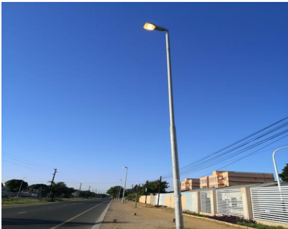
Figura 2: A iluminação pública acesa pela manhã na estrada nacional 4 (N4) (Fonte: Autor, Maio 2020).

Nas principais áreas urbanas e periurbanas, alguns residentes têm se envolvido em práticas de roubo de energia elétrica através de alterações dos contadores elétricos ou instalações elétricas ilegais. Esta atividade do mercado informal de energia elétrica é, em parte, uma resposta aos problemas de acessibilidade da tarifa de energia para os consumidores domésticos. No entanto, isso cria um ciclo de auto-perpetuação de baixo investimento e acesso a serviços de baixa qualidade. O roubo de eletricidade desestabiliza ainda mais as infraestruturas elétricas e reduz o lucro de EDM, prejudicando ainda mais a capacidade da empresa de manter baixo custo de energia para os consumidores. Os residentes urbanos comuns em algumas vezes também tem construído infraestruturas, como edifícios residenciais e