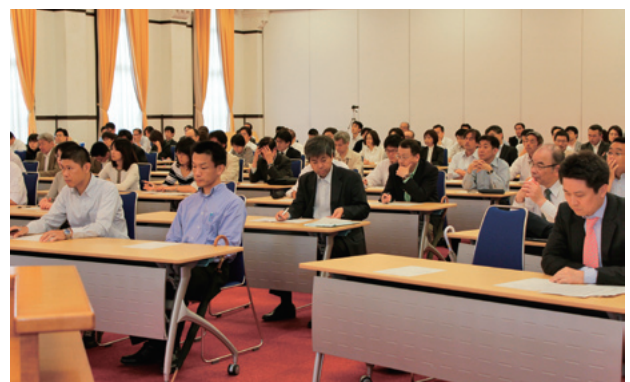
熱心に耳を傾ける参加者たち

員が広報マインドを持った上で組織として活動すること、今後の展開を想像しつつ対応すること、また、報道機関と良好な信頼関係を構築することの大切さを強調され、参加者は真剣な面持ちで聴き入っていた。