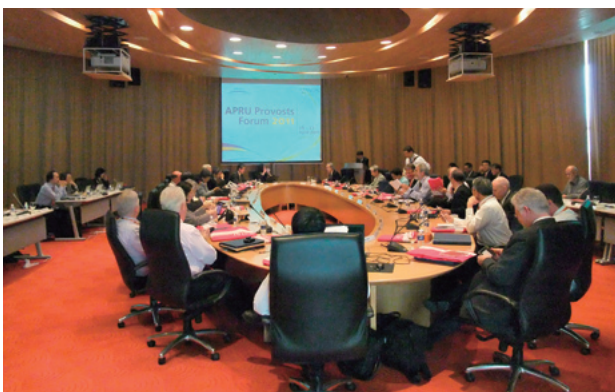
全体報告セッションの様子

なお、Forumのプログラムには、シンガポール国立大学のキャンパスツアーがあり、同大学では最先端の研究施設、学習環境を整備しているとの案内どおり、立派な研究棟、宿泊施設および同窓会施設を見学することができた。