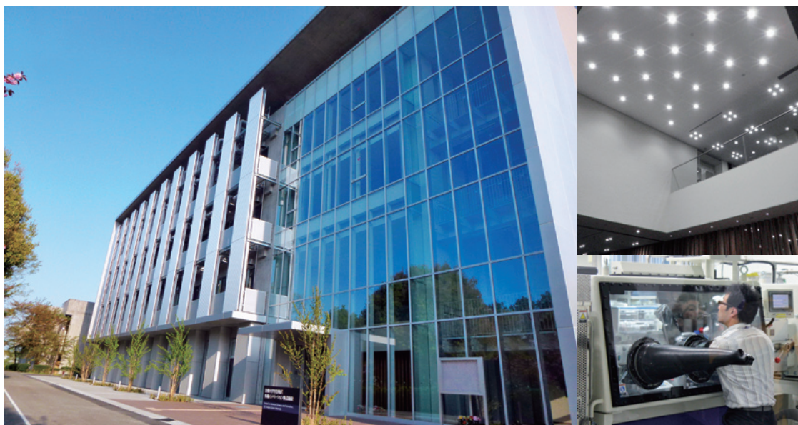
宇治地区先端イノベーション拠点施設 —関連記事 本文3448ページ—