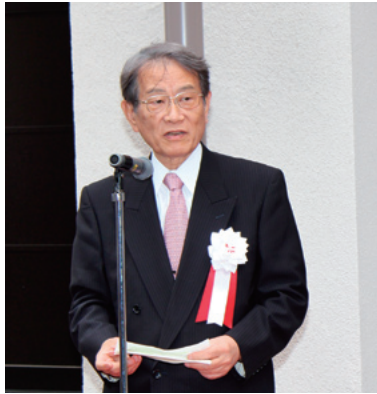
松本総長による挨拶

の開所式を開催した。このハブ拠点は、文部科学省の「成長戦略への布石」である「環境・エネルギー技術への挑戦」の一環として設立された