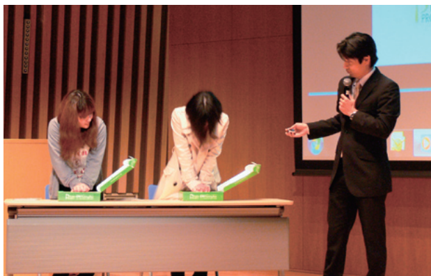
トレーニングキット「あっぱくん」を使用して救急処置を練習する学生

を実施する学部4回生、大学院生および新規配属の教職員等を対象に毎年実施しているもので、今回は計268名(学生199名、教職員69名)が受講した。