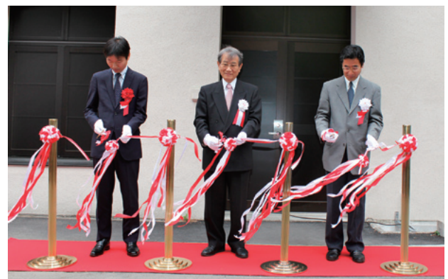
左から柿田基盤研究課長、松本総長、西阪理事