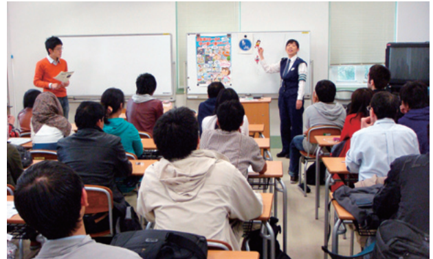
川端警察署による講義の様子