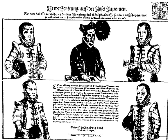
<答え:天正遣欧使節肖像画>

遣欧使節4人の動向を伝えるドイツの新聞(1856)。 中央は案内役を務めたイエズス会のメスキータ。 (『日本史大事典』平凡社)