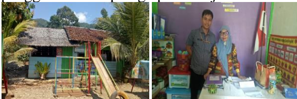
Gambar 2. Panitia Melakukan Pemetaan Masalah Para Guru di Lapangan (Lembaga TK)

Selanjutnya, tahap observasi dan identifikasi masalah di lapangan digunakan untuk melakukan pemetaan. Dalam pemetaan ini, panitia mendatangi satu persatu lembaga TK yang dianggap memiliki masalah dengan penggunaan alat peraga pembelajaran.