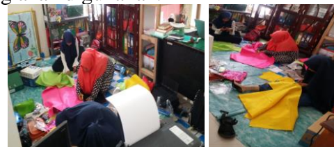
Gambar 3. Panitia Membantu Para Guru Menyediakan Alat dan Bahan yang Digunakan dalam Pelatihan

yang diberikan oleh pemateri yaitu (1) bagaimana merancang pembelajaran menggunakan Busy Book , (2) bagaimana mendesain busy book yang sesuai untuk anak, dan (3) bagaimana membantu guru dalam menuangkan berbagai aktivitas sehari-hari baik di rumah dan di sekolah ke dalam Busy Book serta bagaimana melakukan pembiasaan pada anak mengikuti alat peraga Busy Book yang dibuatnya. Selanjutnya, pada proses pelatihan pembuatan Busy Book , guru diarahkan untuk menyiapkan alat dan bahan yang akan digunakan.