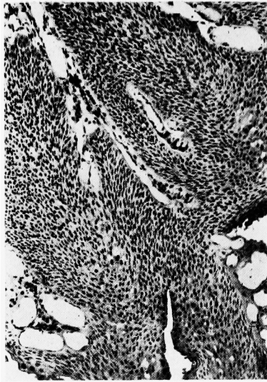
Fig. 1. Histology of case 1 (HE)