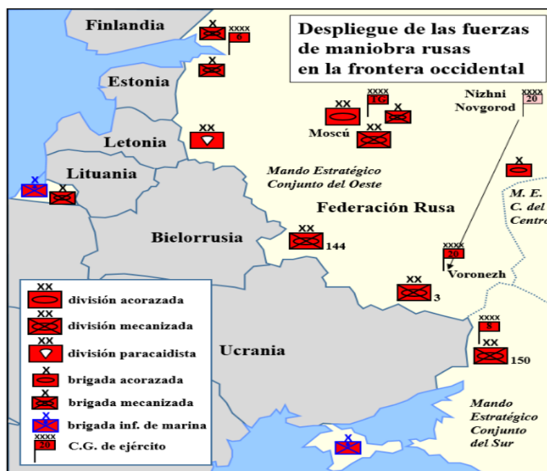
Ilustración 2 Despliegue de las fuerzas de maniobras rusas en la frontera occidental. Fuente: Consideraciones estratégicas de la reforma militar rusa [18, p.13]

Hoy en día, tanto los expertos consultados (ver ANEXO 2), como la mayoría de los analistas internacionales, coinciden en considerar a las FFAA rusas un instrumento militar moderno y eficaz, capaz de hacer frente a los conflictos actuales. Rusia cuenta además con una gran determinación en el uso de la fuerza y con la experiencia acumulada durante las distintas