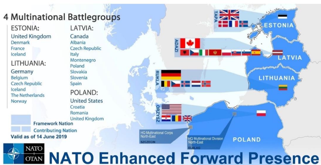
Ilustración 1 Composición por naciones de los Battlegroup de la misión eFP.

Para lograrlo, fueron desplegados cuatro Battlegroups 3 en cada uno de los países miembros que comparten frontera con Rusia -Estonia, Letonia, Lituania y Polonia-, estando al mando de cada uno de ellos Reino Unido, Canadá, Alemania y EEUU respectivamente, sumando un total de más 5000 tropas desplegadas[10]. La ilustración 1 describe la composición por países de cada uno de los grupos y su posición a lo largo del frente báltico.