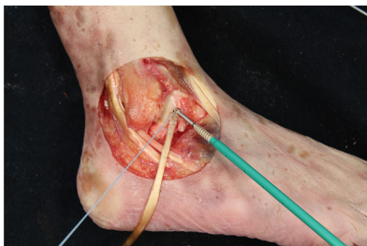
Figura 5 Tobillo derecho. Inserción de plastia tendinosa de EHL en túnel ciego talar y posterior fijación con anclaje de 4,75 mm.