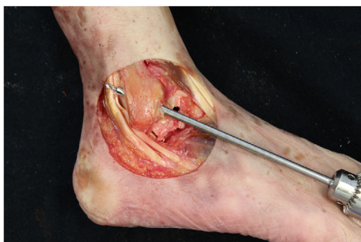
Figura 4 Tobillo derecho. Brocado en huella anatómica del túnel fibular con inclinación de 50° en sentido distal-anterior a proximal-distal.