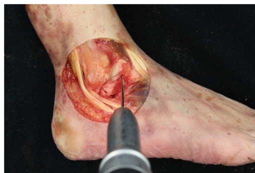
Figura 3 Tobillo derecho. Aguja guía en huella anatómica talar del LTFA para posterior brocado de un hemitúnel de 5 x 25 mm.

Para valorar la estabilidad empleamos las maniobras de cajón anterior (CA) y de estrés en varo (EV), de manera análoga a la práctica clínica 18 . La fuerza es aplicada manualmente, siempre por el mismo investigador, respetando la realización de las maniobras de estabilidad en el mismo