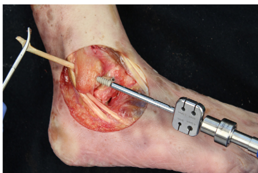
Figura 6 Tobillo derecho. Introducción de la plastia por el túnel fibular y fijación con tornillo de biotendosis de 5,5 mm.

astrágalo y la fijamos con un anclaje de 4,75 mm (Swive-Lock Arthrex Inc.) (fig. 4). El extremo opuesto lo pasamos a través del túnel fibular y lo estabilizamos con un tornillo de biotendosis de 5,5 x 20 mm (BioComposite Tenodesis Screw, Arthrex Inc.) (fig. 5). Durante la fijación, es importante mantener el tobillo en una posición de ligera eversion y dorsiflexión neutra. Cada túnel es recomendable realizarlo 0,5 mm mayor que el diámetro de la plastia, para facilitar el paso de la misma. Repetimos ambas maniobras (CA y EV), con la técnica de reconstrucción realizada (fig. 6).