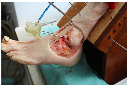
Figura 2 Instrumento de medida. Detalle del sensor localizado en el astrágalo.

desarrollada para el uso de un microcontrolador Arduino Mega 2560, con la ayuda del Mpu6050, una unidad de medición inercial (IMU) 16 . Mediante un algoritmo de fusión fue posible la adquisición e interpretación de los datos recibidos por la IMU. El software permitió analizar el desplazamiento angular del astrágalo, en tres planos simultáneamente, en tiempo real, utilizando los ángulos de Tait-Bryan 17 .