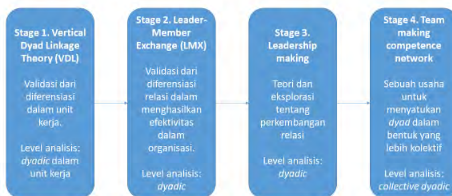
Gambar 3 Perkembangan teori LMX dari tahap ke tahap. (disadur dari Graen & Uhl-Bien, 1995)

untuk membentuk relasi yang dewasa (Graen & Uhl-Bien, 1995). Relasi yang dewasa inilah yang berjalan secara efektif dan tertuang dalam dialektika leader-follower yang maksimal. Peneliti berargumen bahwa analisis yang ada di dalam ini akan mampu digunakan untuk memperjelas adanya batasan baru dalam Leader-Member Exchange yang berada di stage 2. Penelitian ini memperoleh tiga hasil argumentasi dasar yaitu: