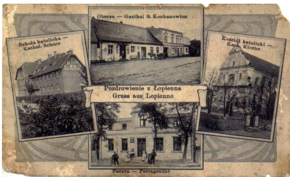
Fot. 1. Poczta z Łopienna, początek XX w.; w zbiorach Szkoły Podstawowej w Łopiennie