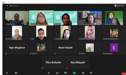
Gambar 1. Acara Pembukaan

diharapkan membawa dampak yang besar bagi kedua insitusi. Sesi pembukaan disajikan pada gambar 1.