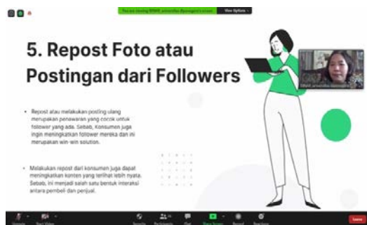
Gambar 3. Paparan Materi 2

pemasaran pada Instagram menjadi topik utama, diawali dengan penjelasan bagaimana melakukan setting Instagram bisnis, jenis-jenis postingan IG, cara melakukan posting, membuat konten menarik, kapan waktu yang tepat dalam posting, memanfaatkan Instagram Ads, dan kerjasama dengan influencer atau selebgram untuk meningkatkan jangkauan pemasaran. Penyajian materi kedua di sajikan pada gambar 3.